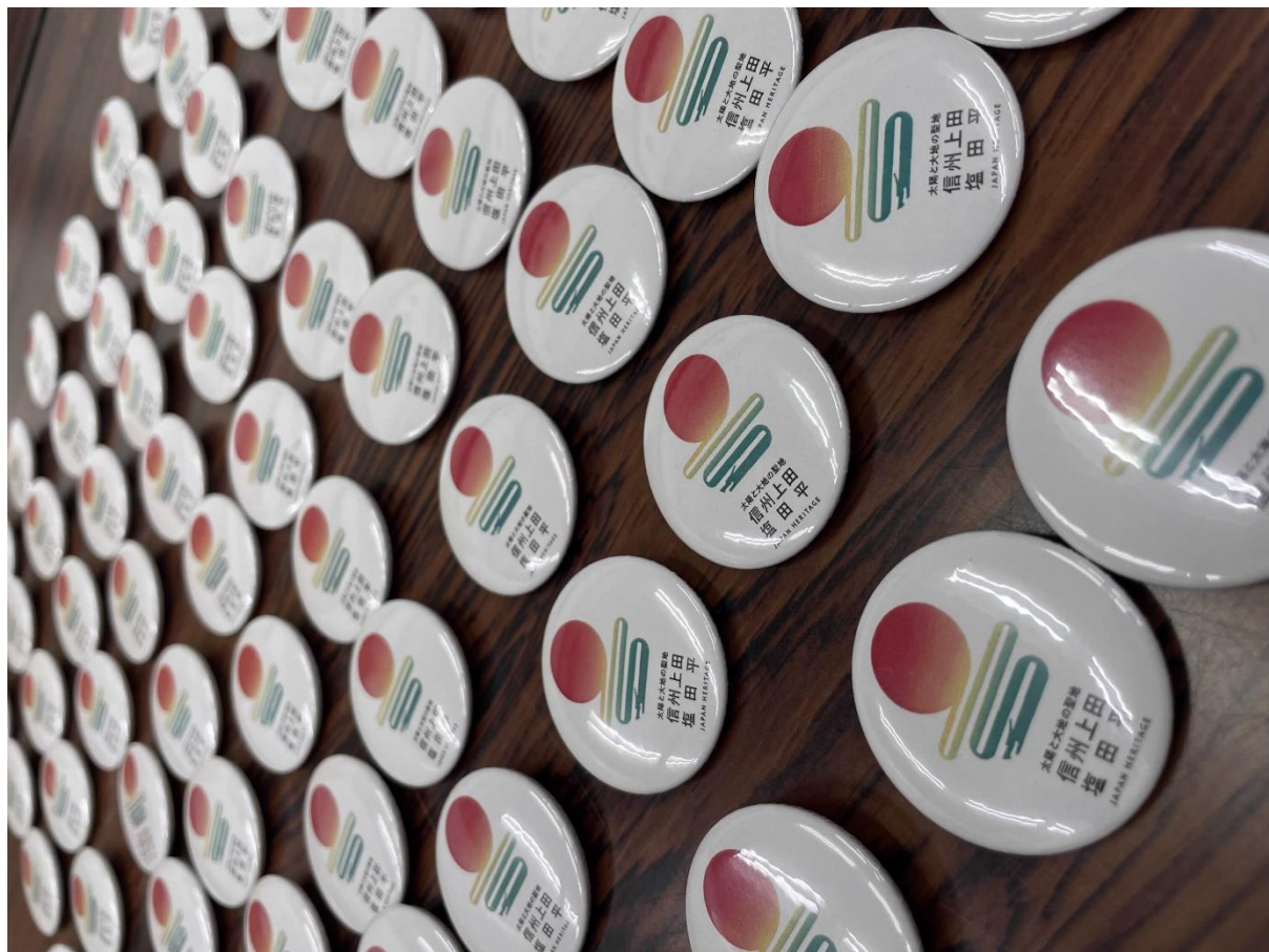
例3 製品のイメージ (製品写真の場合)