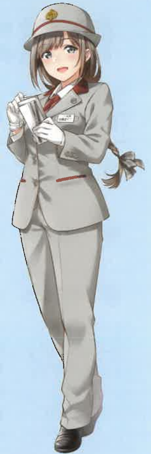
長野電鉄 鉄道むすめ 朝陽 さくら