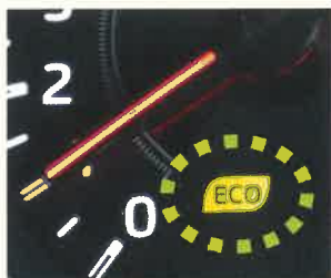
エコドライブランプの例

①エコドライブランプ ※ を点灯するように運転しましょう。アクセルをふんわり踏んで運転することになり、燃費が良くなります。