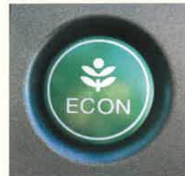
エコドライブスイッチの例

②エコドライブスイッチ ※ をONにしましょう。車の制御が変わって、ゆっくり加速しやすくなり、燃費が良くなります。