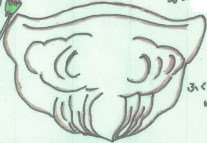
ふくすけ柄 ねこ瓦