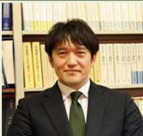
講師 千葉大学大学院社会科学研究院教授