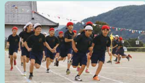
武石小学校運動会 9月30日(土)