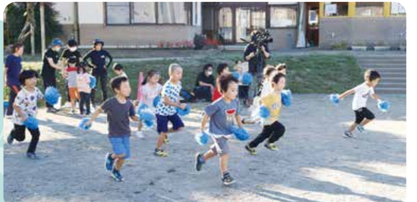
武石保育園運動会 9月29日(金)