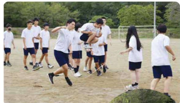
依田窪南部中学校「紫苑祭」体育祭 9月22日(金)・23日(土)

の事業所で学び、3年生は「地域の課題を見つけ未来について考える」をテーマに、起業家精神(アントレプレナーシップ)学習を行い起業や商品開発等について考えた発表がありました。また、フリーフェスや、南中生の主張等、それぞれが輝ける企画が盛りだくさん、透き通る声で絶妙な掛け合いで行われた司会進行のもと、個性が活かされた発表があり、一人一人が輝いた2日間でした。 このような素晴らしい取り組みをもっともっと多くの地域の方にも観覧してほしいです。