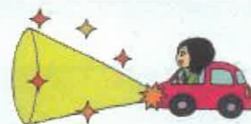
ロービームのときは 時速40キロメートル以下で走行