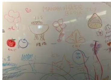
秋といえば・・・