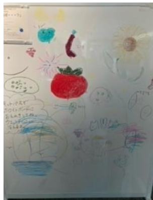
夏といえば・・・