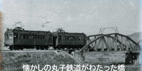
懐かしの丸子鉄道がわたった橋