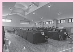
福祉避難所の様子

上田市社会福祉協議会では、3月14日(木)から3月18日(月)まで長野県災害派遣ふくしチーム(DWAT)として職員1人を能登町小木福祉避難所へ派遣し、運営支援を行いました。3月末での福祉避難所閉所へ向けて、自宅での生活を検討する方、地元の福祉施設への入居を検討する方など、避難者の意思決定に寄り添う支援を行いました。