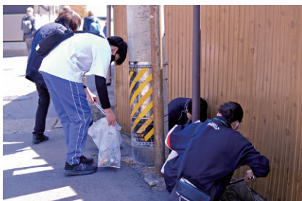
ゴミ拾いボランティア

今回は、市内の中学生・高校生が、上田市街地のゴミ拾い、切手整理、雑巾縫い等を行いました。ゴミ拾い活動では、参加者自らが活動エリアを考えて活動しました。