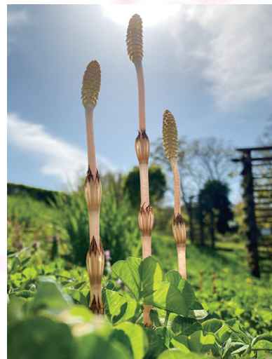
ひかりに透ける / まるま