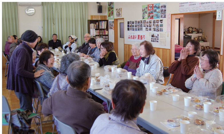
食後にみんなで談笑