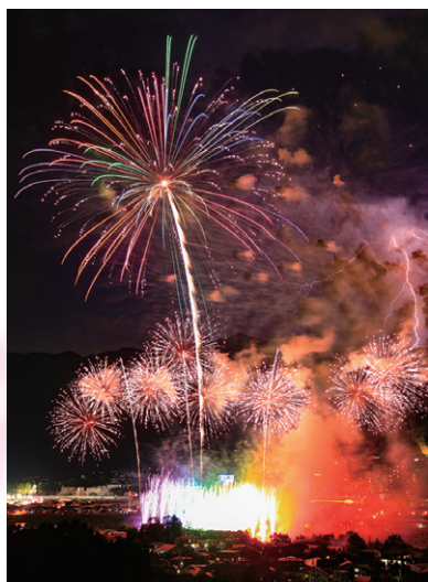
火神鳴り(ひがみなり) / 藤井 順也