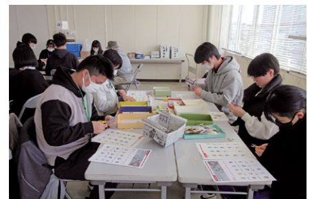
切手整理ボランティア

参加者からは、「直接ではないかもしれないけど、間接的に人の役に立つことができ嬉しかった。」「すれ違った地域の方に、ありがとうと言われて、地域のために働くことの大切さを学んだ。」といった感想が聞かれました。