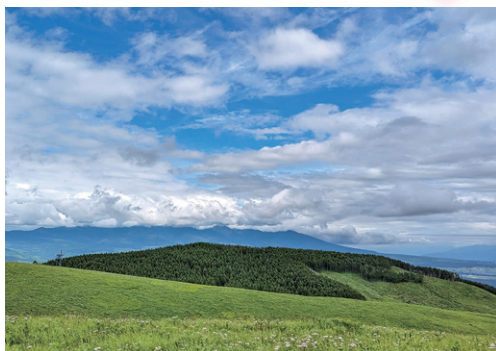
霧ヶ峰 富士見展望にて / T-GUCCI