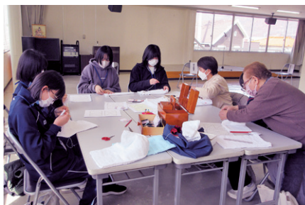
雑巾縫いボランティア