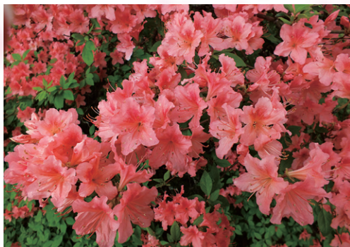
ツツジ / 富江