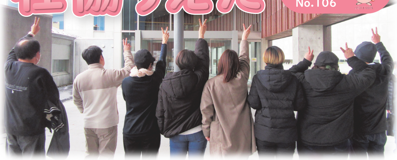
「My ふおと倶楽部」受講者のみなさん