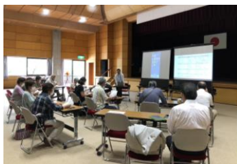
スマホの使い方講座

今年度も真田中央公民館でさまざまな講座を開催予定です。毎月の公民館だよりにて随時お知らせします。一緒に交流したり、スキルを身につける機会として、お気軽にご参加ください！