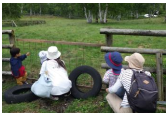
菅平牧場へ行きました