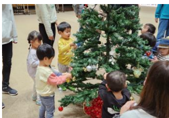
クリスマスツリーの飾りつけ