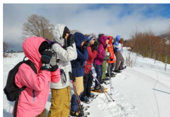
スノーシュー講座