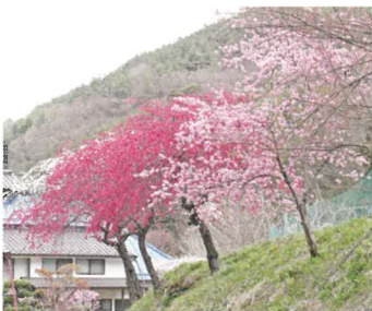
③トキノスコース (0.7km) 余里では、普段の生活を忘れゆくりと花桃を眺められます。