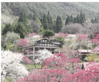
①ホドガイコース (0.3km) 山畑に咲く花桃を間近に見られます。