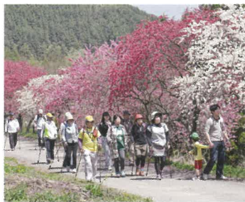
④宮前コース (0.6km) 赤白の花桃が咲き乱れる“世界中で一番きれいな二週間”は、見る人に感動を与えます。