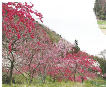
②中央農道コース (1.2km) 新緑の中から見下ろす花桃は、また違った景色が楽しめます。