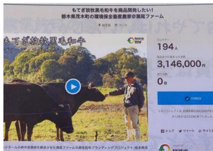
販売構築した黒毛和牛

行革甲子園グランプリ受賞という、全国で認められるシティプロモーションを行っているにもかかわらず、審査委員長の評価とは真逆で、町のリーダーの支援は受けられず、組織風土も全くかわっていない現状を直接面談して感じた。茂木町の地方創生(令和 5 年版)の取り組み方針には、行革甲子園のグランプリ受賞・地域商社の取り組みの内容は何一つ触れられていない。首長が若年職員がチャレンジできる組織風土への変革を実行しておらず、町の職員も 133 人のうち、1 割は理解。8 割は無関心。ブレーキをかける職員が 1 割とのこと。行革グランプリ受賞をきっかけとした役所の変革を予想していたが、役所の体制は変わっていないのが現状であり、調査の中で、上田市と同様に町の組織風土がやりたいことがやれる状態になっていない様子が伺えた。首長の支援不足と組織風土を変えることの困難さを改めて感じた。