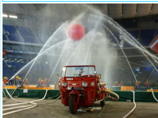
消防団120年・自治体消防65周年記念大会 上田市丸子第三分団による、天覧放水実演