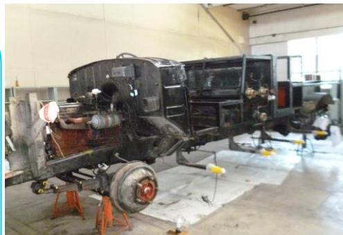
分解された車体、エンジン部分とポンプ部分 （2014/10 上田市丸子旧カネボウ丸子工場食堂棟）