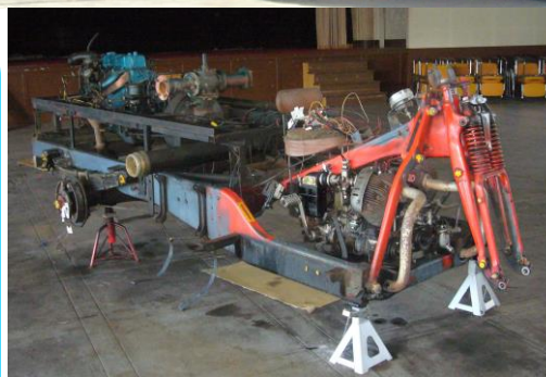
レストア中の車体用エンジンと後部のポンプ用エンジン (2009/6 上田市丸子旧カネボウ丸子工場食堂棟)