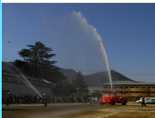
修復完了お披露目式 上田市丸子第三分団による、二線式放水披露