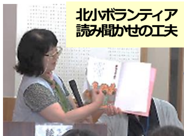
北小ボランティア 読み聞かせの工夫

「読み手は絵本を子どもをつなぐハイブ役め読み方等、立ち位置、読み方等の工夫が発表されました。」