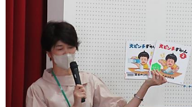
川西小司書 絵本の選び方

1年に1回各学級の授業の時間に読み聞かせをしています。語りなど、生のお話を聴く機会を大切にしています。