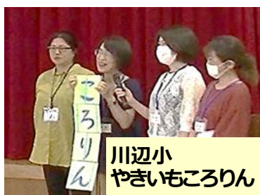
川辺小 やきいもころりん

1年に1回各学級の授業の時間に読み聞かせをしています。語りなど、生のお話を聴く機会を大切にしています。