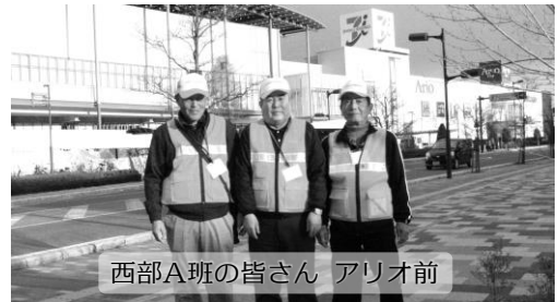
西部A班の皆さん アリオ前

当日は、年末商戦まっただ中、アリオは今まで見たことないほどの込みようでした。我々のオレンジのベストの背中のお客さんもいました。我々の活動が、市民の皆さん、青少年に伝わることを願ってやみません。