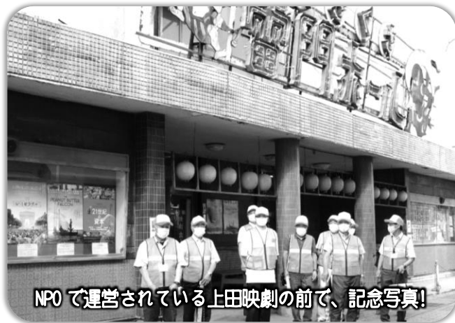
NPOで運営されている上田映劇の前で、記念写真!

『まちキャン』は、「大学と連携しながら、高校生や大学生ばかりではなく、地域の方も大勢参加される多彩な活動をしている」ことを知りました。