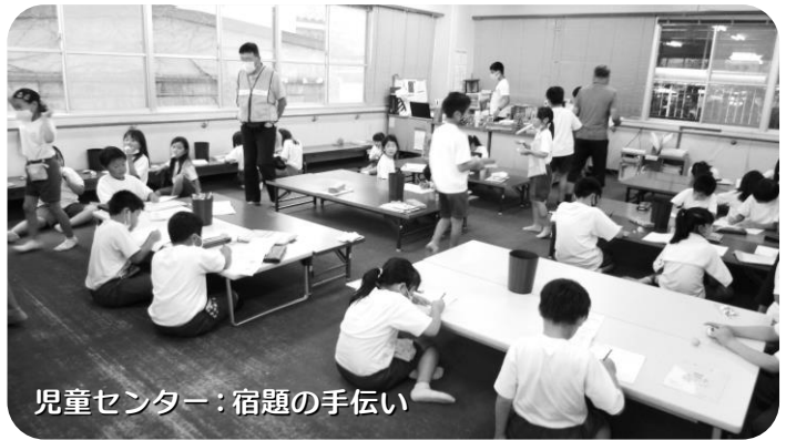
児童センター：宿題の手伝い

ところで、上田市においても新型コロナウイルス感染症は大問題となっております。通常の定期補導活動は各班の判断で無理のない範囲で引き続きお願いするところです。しかしながら、一堂に会する、たくさんの人たちが集まる集会等はできなくなってまいりました。地区会長・班長会や研修会等、今までの予定を変更せざるを得ないと思われると思います。追って連絡いたしますのでよろしくお願いいたします。(事務局)