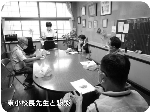
東小校長先生と懇談

今回は、東部南児童クラブ（東小学校3年生から5年生まで）を訪問させていただきました。