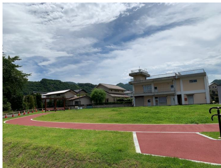
〈東側よりにぎわい広場を望む〉