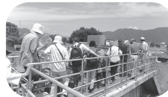
大学院での現地研修(浄水場)