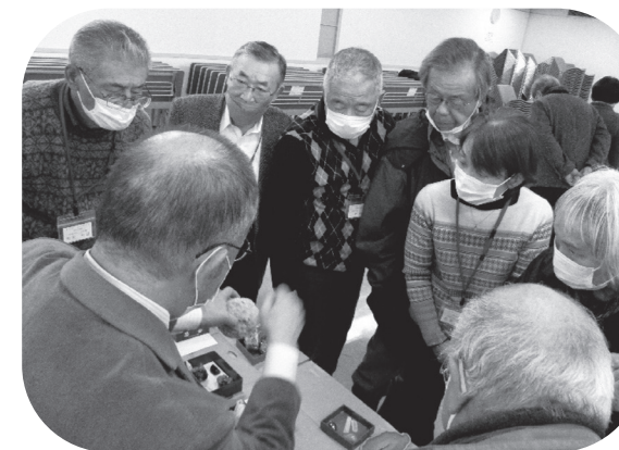
ことぶき大学の講義風景