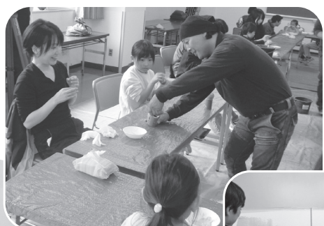
(組合員さんに磨き方のコツを教えてくださいました)