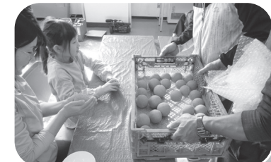
(着色した漆喰を塗って、ピカピカになるまでひたすら高で表面を磨きます)

上小左官事業協同組合の組合員さんに教えていただき、どろを磨いてピカピカのおだんごを作りました。お子さんはもちろん、大人の皆さんも楽しく作業に没頭していました。どろだんごを作った後は、「こて」を使っての塗り体験も行い、左官のお仕事について理解を深めていただくことができました。