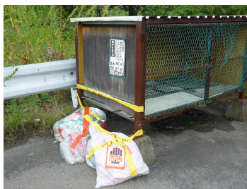
ごみ集積所に出された ルール違反のごみ

ごみ集積所は、各利用者のごみを一時的に仮置きする場所です。 地域ごとに決められた曜日や時間以外にごみを出してしまうと、近隣の皆さんに多大な迷惑をかけることとなります。 マナーやルールを守り、美しい環境を保つようにしていきましょう。