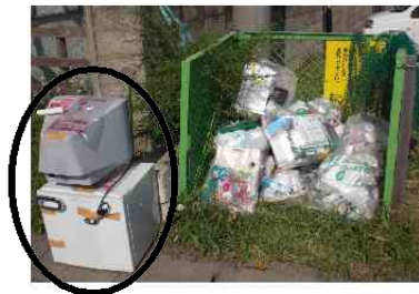
ごみ集積所に出されたルール違反ごみ(家電製品)

ごみは、生活していく上で避けて通ることのできないものです。自治会が管理するごみ集積所を利用する場合は、ごみ当番など、地域でルールを決めていただき、利用者の皆さんが協力して管理していただくようお願いいたします。