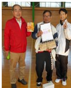
★B ひばり A