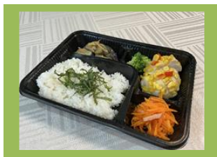
健康講座 「姿勢測定」の様子→

23名の仲間と学び合った「すこやか大学」が終了しました。初回6月はレクレーションをしながらそれぞれが知り合い、7月は夏の香味ご飯などのお弁当をつかって持ち帰り、8月はダンスに眠っている着物などの布でブローチを作りました。9月はバイオリンを中心としたクラシック音楽を聞き、10月は認知症について学び、最終回11月は健康体操で心も体もリフレッシュ!そして、仲間づくりの場ともなりました。「健康講座」は、9月からほぼ毎週木曜日に開催し、11/6(木)に終了しました。初回到理学療法士から体力測定や姿勢測定をしてもらい、自分の体について知ってから、2回目以降は体操やウォーキングなど、椅子を使いながら体を動かしました。