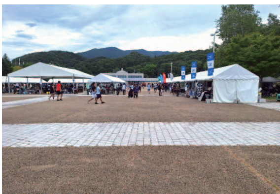
選手控え室・メーカーテント

大会には全国各地から多くの実業団チームが集まり、熱戦が繰り広げられました。会場には大型照明や観客席が整備され、広々とした敷地にメーカーブースや選手控えテントがゆつたりと配置されました。運営の工夫が随所に見られました。