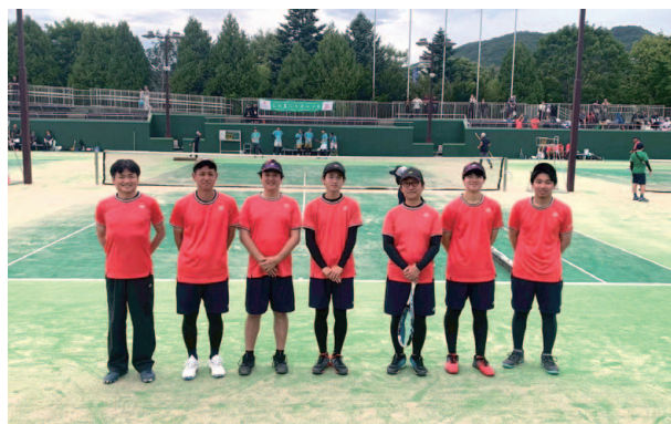
上田ソフトテニスクラブ所属選手