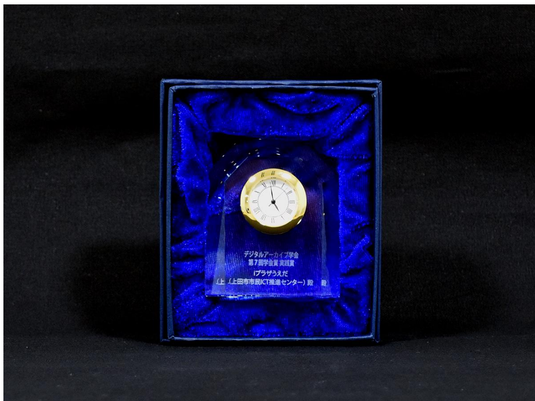
デジタルアーカイブ学会賞 実践賞 副賞の時計