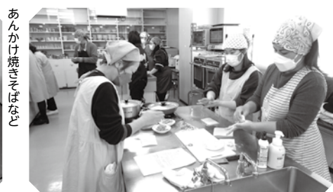
あんかけ焼きそばなど