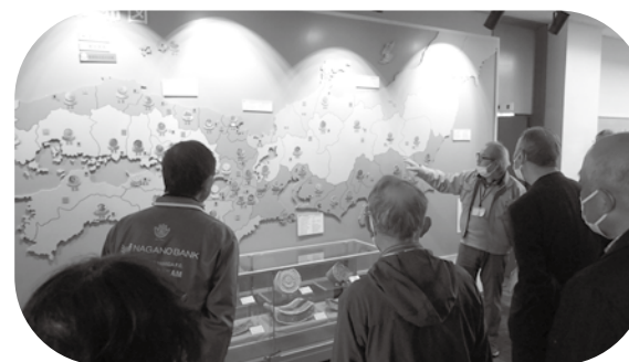
大学院での現地研修（信濃国分寺資料館）