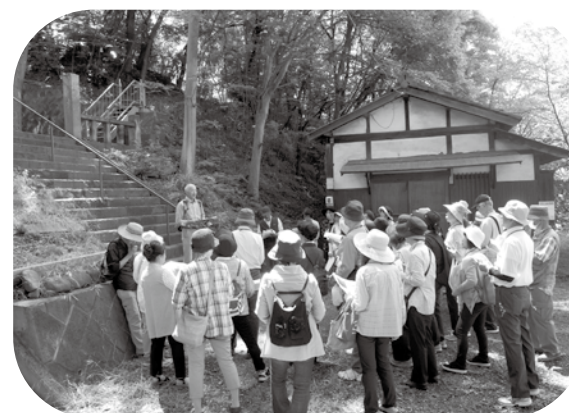
ことぶき大学での現地研修（常田大日堂）