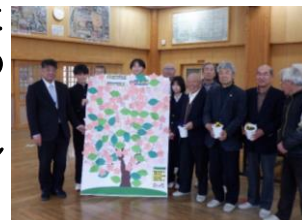
(昨年度のエールの木です)

塩田中学校の学校支援ボランティアのしおだっ子応援団は、毎年塩田中の3年生に「エールの木」という名前の寄せ書きを贈っています。公民館入口にカードとペンがありますので、ご協力をお願いします。