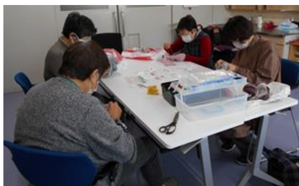
ボランティアの皆さんの活動の様子