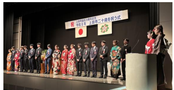
実行委員19名の皆さん

成人式の司会として実行委員を務めました。打ち合わせから本番まで、実行委員や役員の方と準備してきました。一生に一度の成人式、運営側として関わることができた事を嬉しく思います。自分自身の成長になるとても良い経験でした。