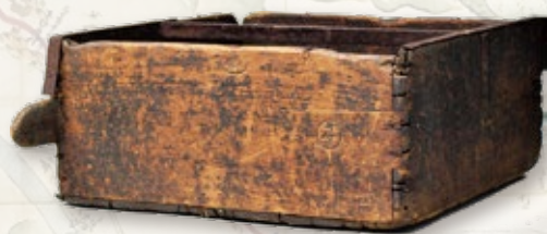
蔵前の大桧（上田市指定文化財）

ぜひ、この機会に新しい収蔵品の一つひとつから歴史的な魅力とその時代に生きた人々の想いを感じてください。