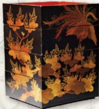
鳳凰桐紋柄蒔絵重箱 （松平家旧蔵）