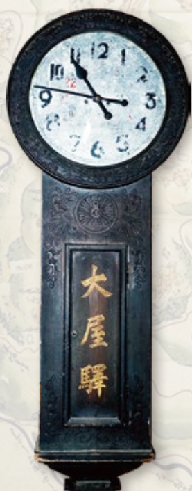
国鉄大屋駅柱時計