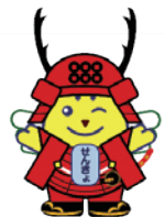
真田三代 めいすいくん (上田市明るい 選挙啓発推進 イメージ キャラクター)