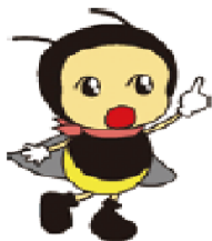
上田市上下水道局形象大使 あかりちゃん