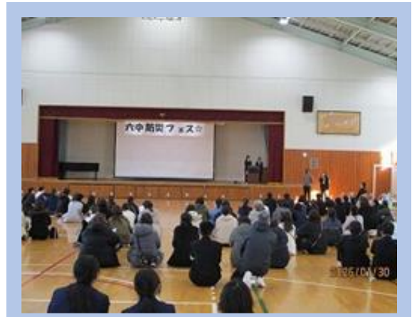
エンディングでフェスのまとめをしている様子