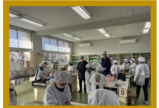
料理づくりを頑張っている様子