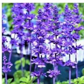
サルビア プラテンシス