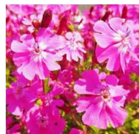
シレネ・ディオイカ