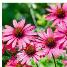
エキナセア (ピンク)