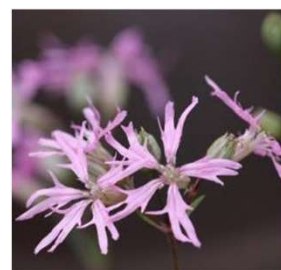
リクニス フロスククリ (ピンクロビー)

花の種銀行で借りた品種以外でも、きれいな花を咲かせるおすすめのものがありましたら種の寄贈をお待ちしております！！