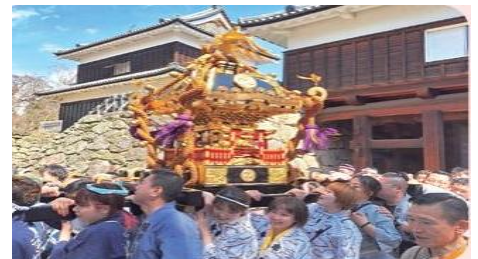
春烂漫 神輿渡御 *4月5日（周日）12:00~15:00 场所：上田招魂社~お堀回り