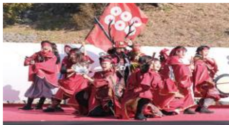
信州上田おもてなし武将隊 城熱演舞 *4月4日（周六）13:00~14:30 场所：上田招魂社