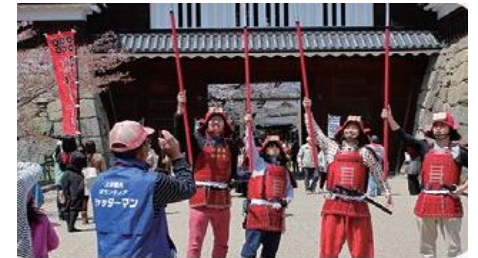
甲冑着用体験 *4月4日（周六）・5日（周日）10:00~16:00 场所：芝生広場(児童遊園地付近)