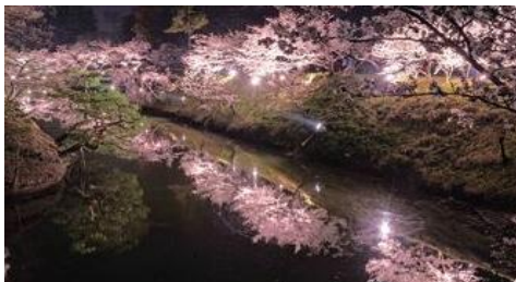
千本桜 灯光秀 *4月4日（周六）~赏樱结束时期 日落（18:30左右）~22:00