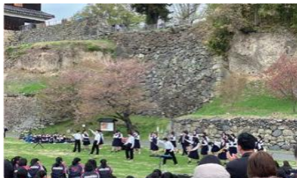
樱花 音乐会 *4月11日(周六) 9:00~11:30 场所：やぐら下芝生広場