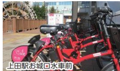
上田駅お城口水車前