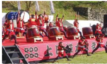
上田城太鼓祭り〈春の陣〉 *4月13日（周日）10:00~ 场所：やぐら下芝生広場