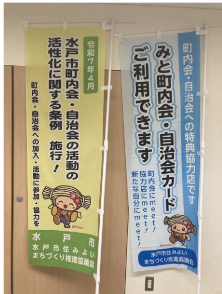
自治会加入促進のぼり

またその為に具体的な政策、①加入者特典割引カード②行政と一体となった直接訪問加入促進③自治会の統廃合に向かた手引きや補助金等は早急に上田市でも実施すべきだと考えます。