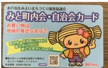
みとちゃんカード

自治会取次依頼制度は宅建協会との協定締結後作成、提出があった場合は水戸市住みよいまちづくり推進協議会へ情報が集約、該当する町内会・自治会へ連絡する加入希望者情報の一元化が図られています。月10件程度の実績があり、電子申請も可能。