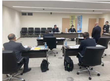
水戸市での視察風景

行政とは別の独立組織で町内会・自治会組織の統括をする水戸市住みよいまちづくり推進協議会を1996年設立、2019年に町内会・自治会促進委員会を立ち上げ、庁内にも地域コミュニティ加入促進検討委員会を設けて検討を進めていた。2020年自治会加入率の低下(H10年84.5%→R7年48%)から自治会加入促進の根拠の明確化の要望が上がり2025年4月に自治会促進条例を制定。自治会・町内会には5つの責務を依頼し、特に運営の透明性、人材育成に尽力頂き、行政は加入促進に関する総合的施策推進及び水戸市住みよいまちづくり推進協議会と地区会(各地域自治会連合)の意見を十分反映することが明記されている。