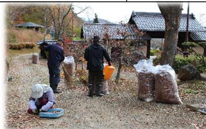
18人の皆様による敷地内のボランティア清掃