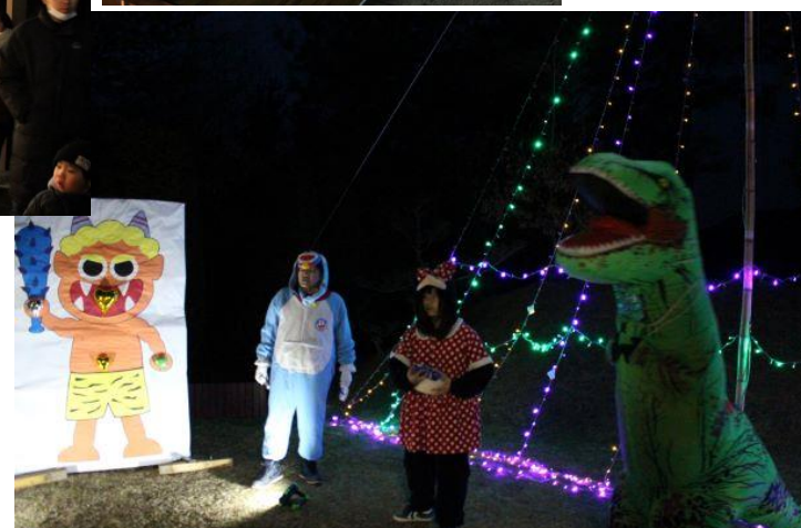
ゲーム鬼退治(ボールあて)