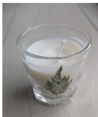
アロマキャンドル