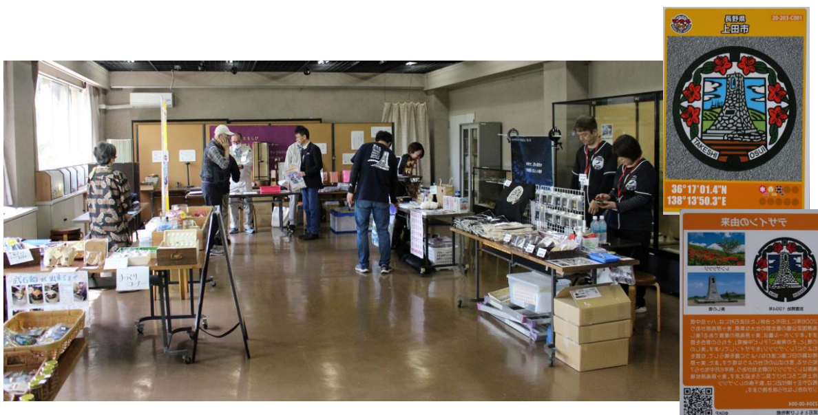
4月25日から マンホールカードを配布(初日)