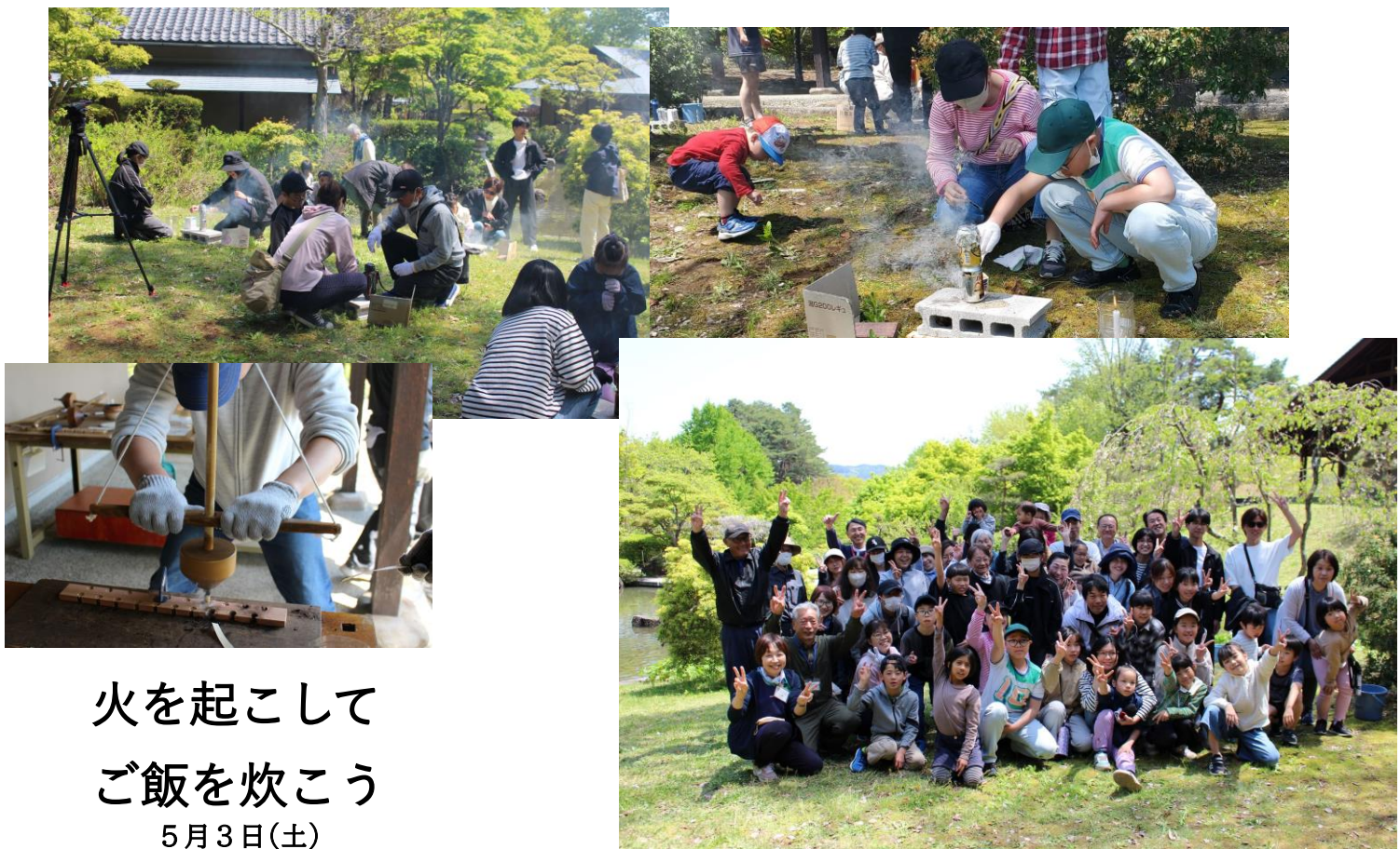
火を起こして ご飯を炊こう 5月3日(土)