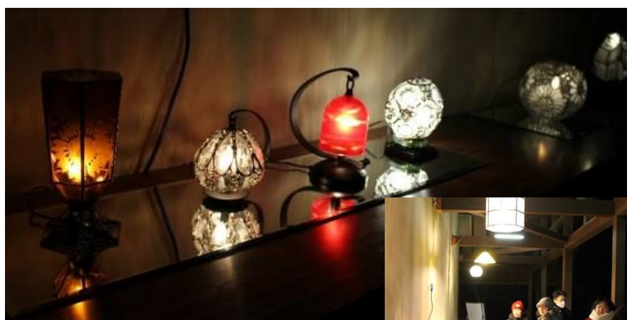
ステンドグラスアート(あわゆき亭工房)