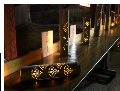
武石小学校5年 竹灯籠