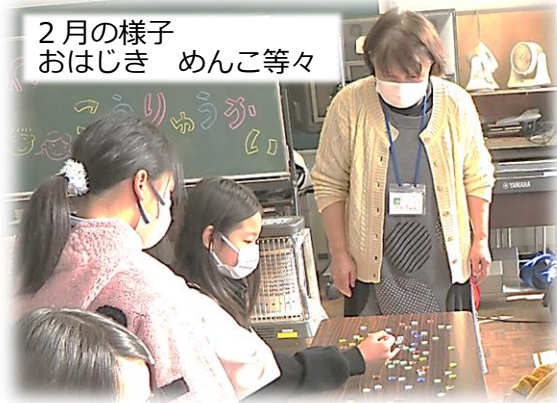
2月の様子 おはじき めんこ等々