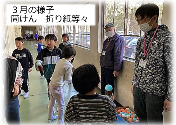
3月の様子 筒けん 折り紙等々