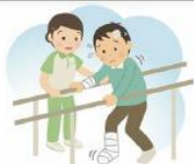
活動中・活動場所への往復のけが