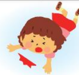
子どもにケガをさせた