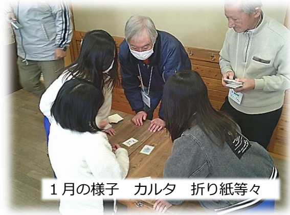
1月の様子 カルタ 折り紙等々