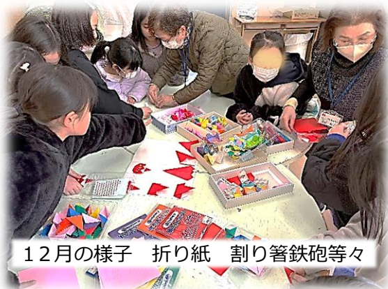
12月の様子 折り紙 割り箸鉄砲等々