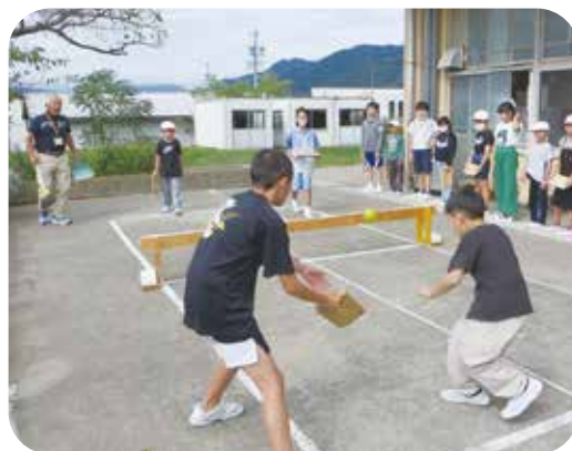
テラスでは子どもたちに大人気 オリジナルゲーム「テニポン」