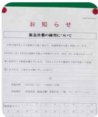
掲示板には先生方からの 御依頼シート