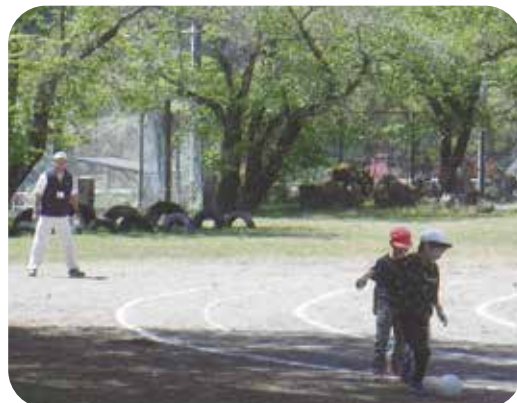
校庭でいっしょにサッカー