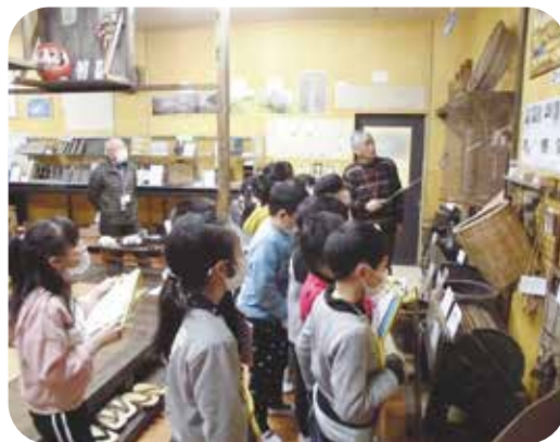
歴史資料館で地域の人と学び合う