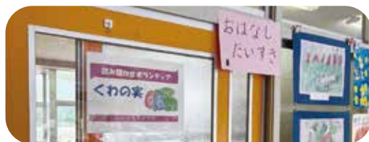
郷土資料室はボランティアの居場所