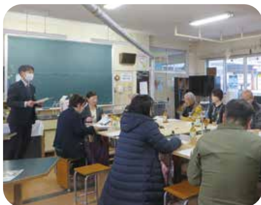
コミュニティスクールについての 会議もルームで開催