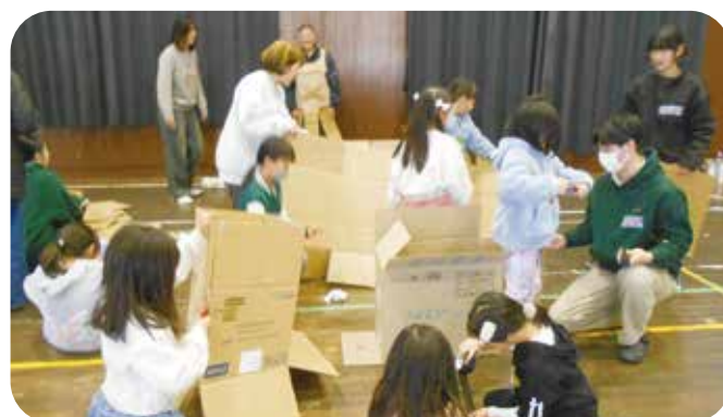
⑫その他 浦里小学校