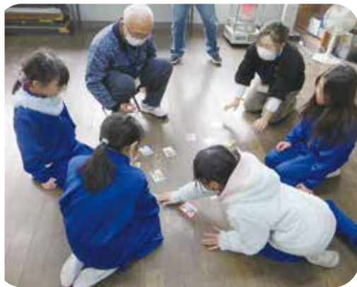
地域の人といっしょにカルタ取り