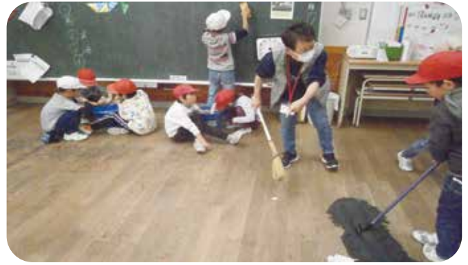
⑩校内活動支援 塩田西小学校