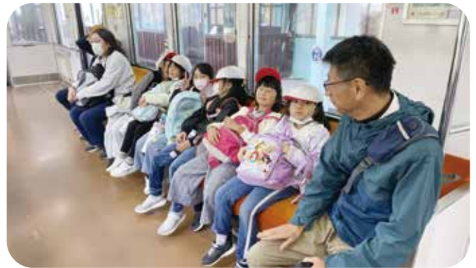
⑪行事サポート 中塩田小学校