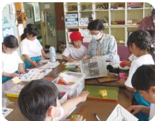
毎日会える地域の人とのひととき