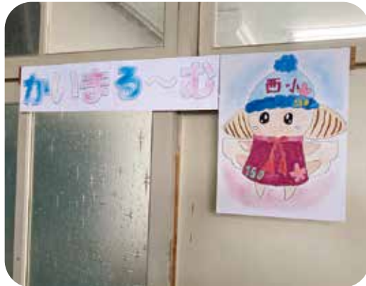
児童が描いたルームの絵