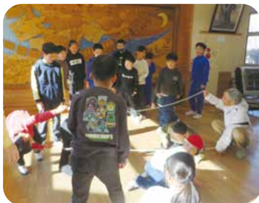
大六ホールでなわとび