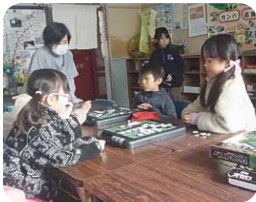
地域の人とゆったり過ごす休み時間