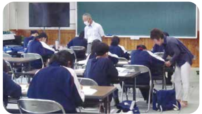
④放課後学習 丸子中学校