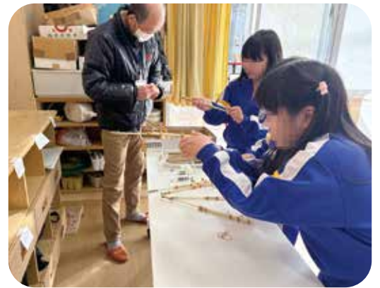
割り箸鉄砲で真剣に的をあて