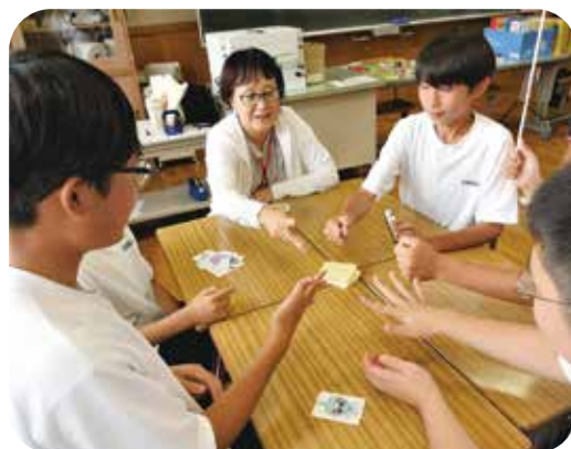
地域の人との交流を楽しむ時間