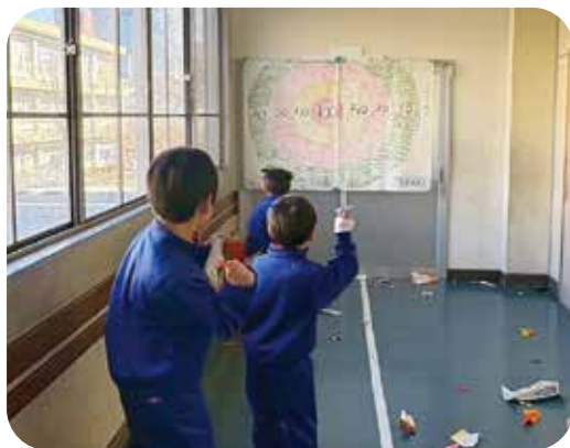
廊下を舞台に紙飛行機飛ばし