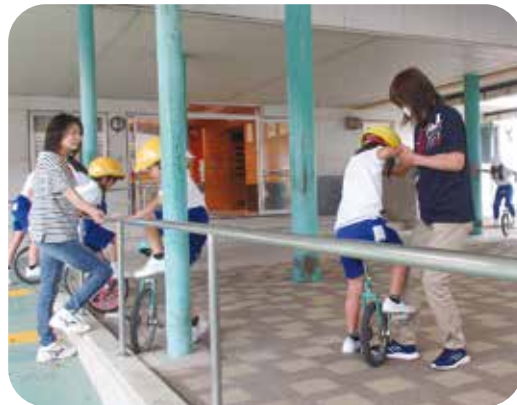
なかよし広場で一輪車乗りを応援