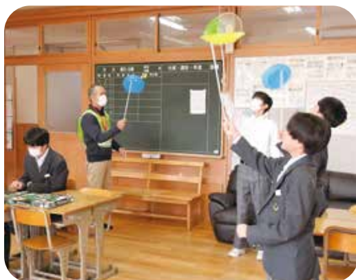
中学生も楽しむサルビアルーム