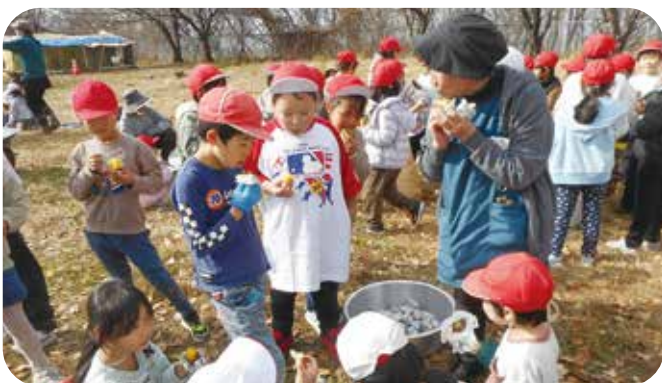
⑪行事サポート 豊殿小学校