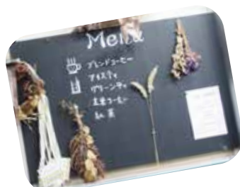
セルフのお茶コーナー