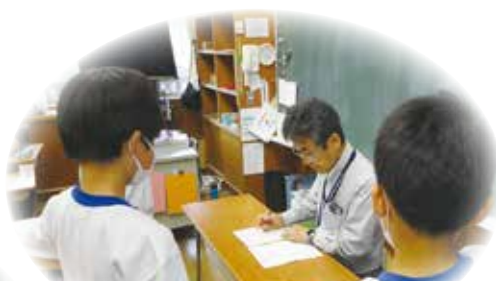
学習支援 チャレンジタイム 丸つけボランティア