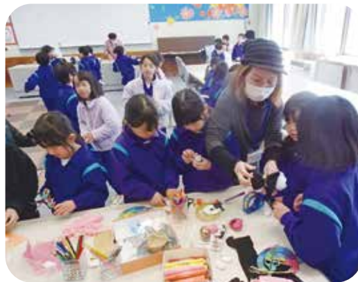
自由な工作・手芸が人気