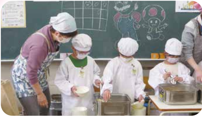
⑩校内活動支援 神川小学校