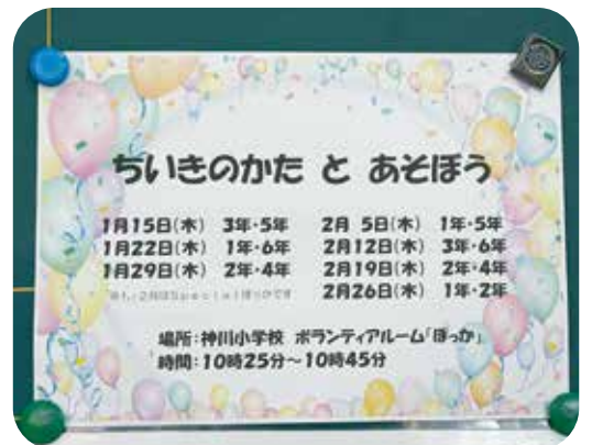
ルームに掲示された予定表