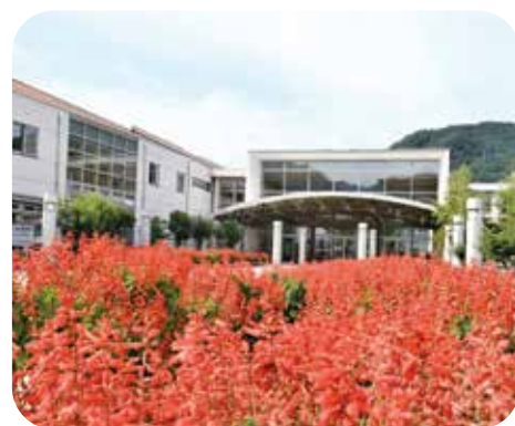
⑦環境整備 真田中学校