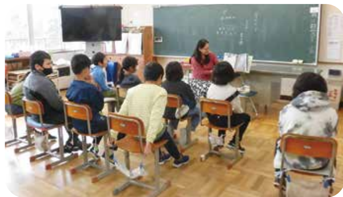
⑧読み聞かせ 菅平小学校