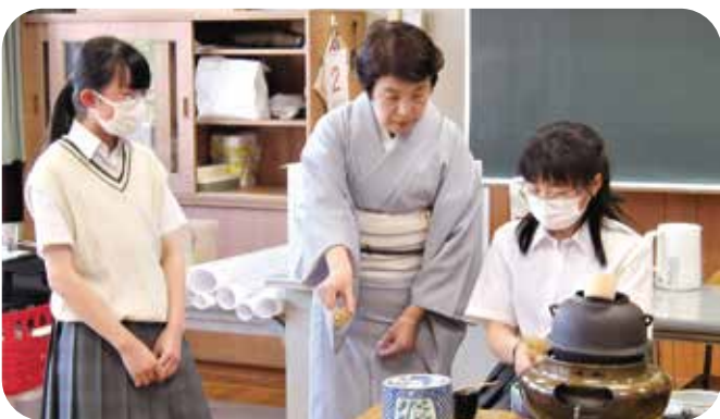
④放課後学習 真田中学校