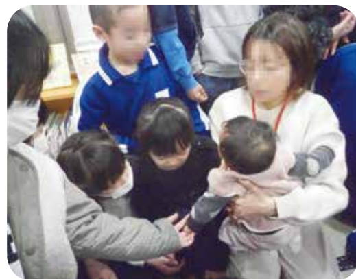
近所の赤ちゃんも遊びに来ます