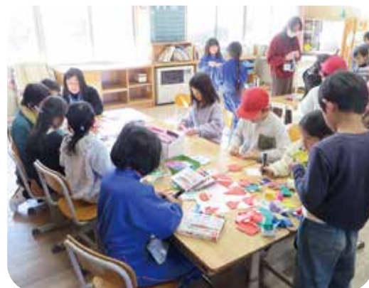
地域の人といっしょに楽しい時間