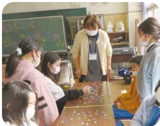
おはじき、めんこ等、昔の遊びが人気