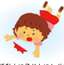
活動中に子どもにケガを負わせてしまった

けがをされた場合は、速やかに、学校または教育委員会生涯学習・文化財課に御連絡ください。