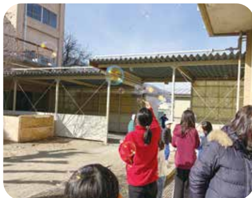
中庭に出てシャボン玉