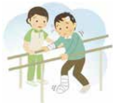
活動中や往復時のケガ

補償内容： 詳細は https://www.fukushihoken.co.jp