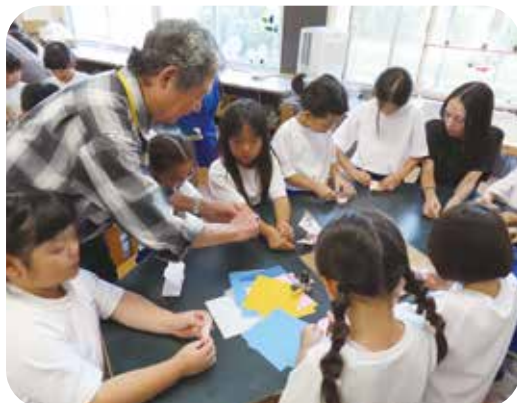
児童会主催の「ふれあいセンター」で 昼休みに児童と交流