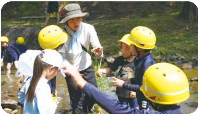
⑪行事サポート 川西小学校