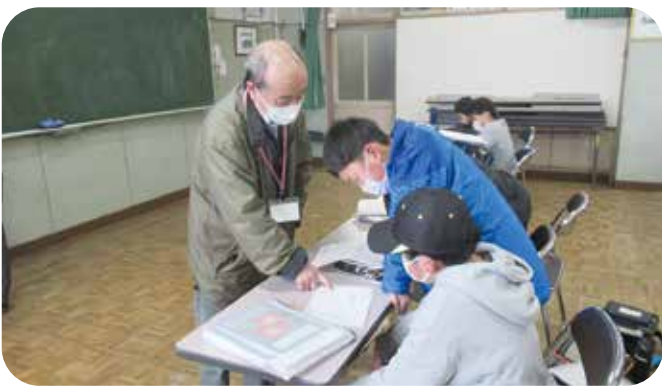
④放課後学習 西小学校