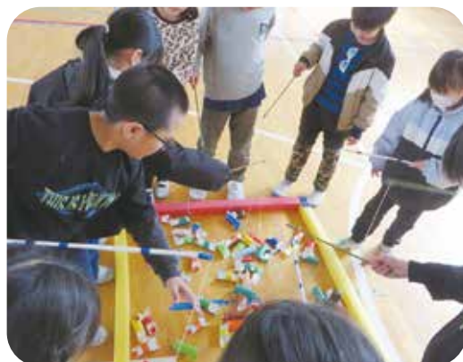
お魚釣り 魚はトイレットペーパーの芯を活用