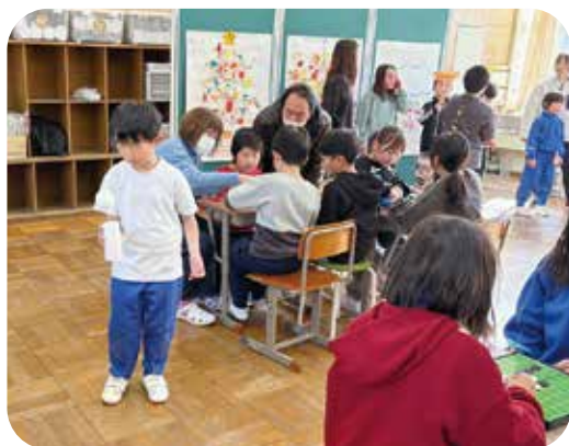
子どもたちで大にぎわい