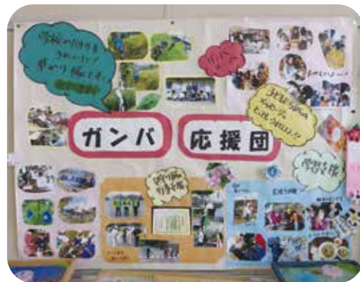
壁に貼られた活動のまとめ