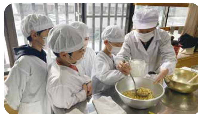
③総合的な学習 武石小学校