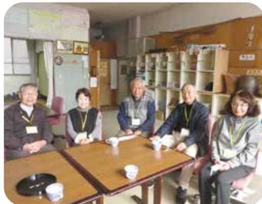
活動の後にはいつも楽しいお茶タイム 貴重な情報交換の時間