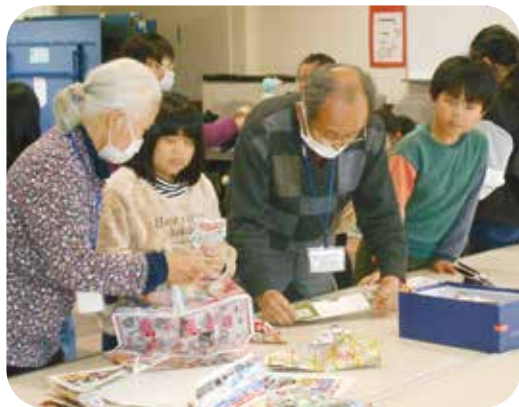
地域の人と楽しい時間