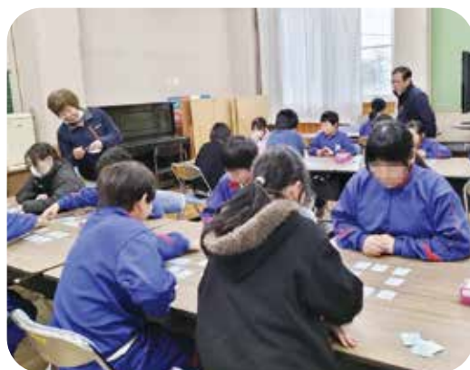
地域の人といっしょに百人一首