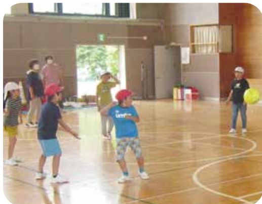
体育館でいっしょにボール遊び