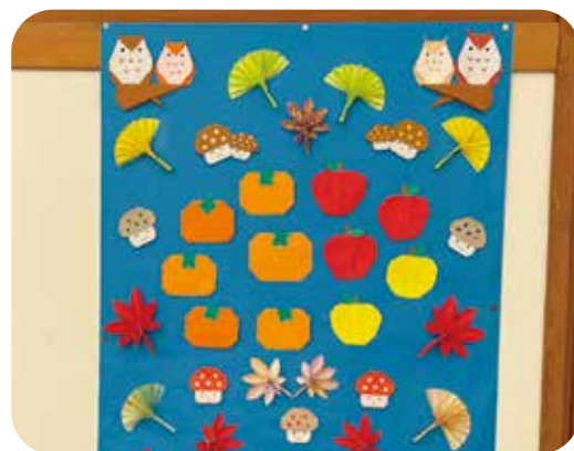
ルームの壁に折り紙で作った季節の掲示物