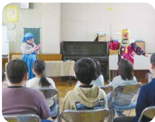
地域の人のマジックショー