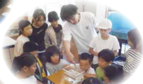
地域の自然を知るお魚教室