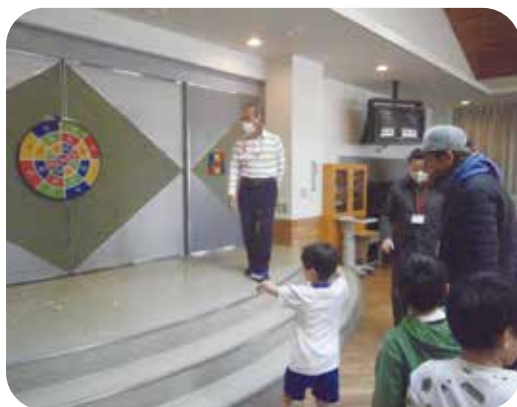
ランチルームでダーツ