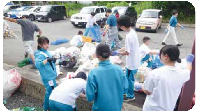
⑪行事サポート 菅平中学校