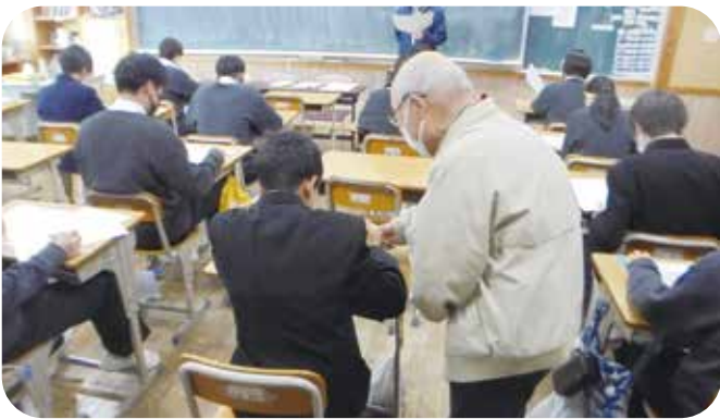
①授業サポート 塩田中学校