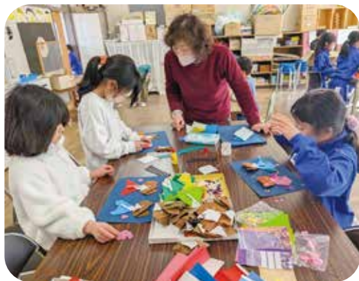
楽しい季節の工作に夢中