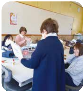
「そえびホール」は 地域の大人の交流の場 (手芸クラブ等)