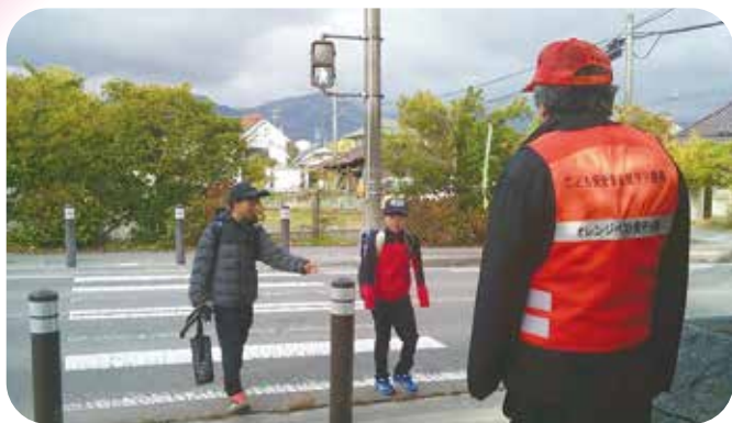
⑤見守り活動 東塩田小学校