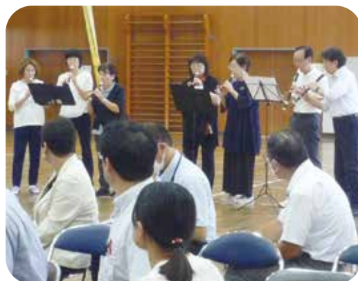
大人の学び リーコーダー部 この日は皆さんの前で発表