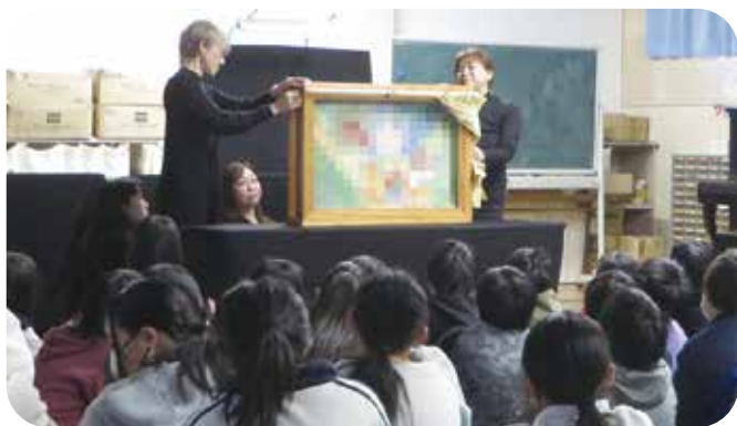
⑧読み聞かせ 南小学校