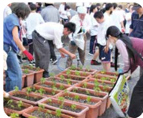
⑦環境整備 真田中学校