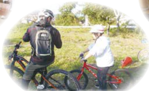
クラブ活動 自転車クラブ