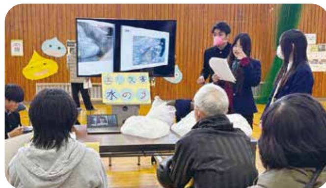
③総合的な学習 第六中学校