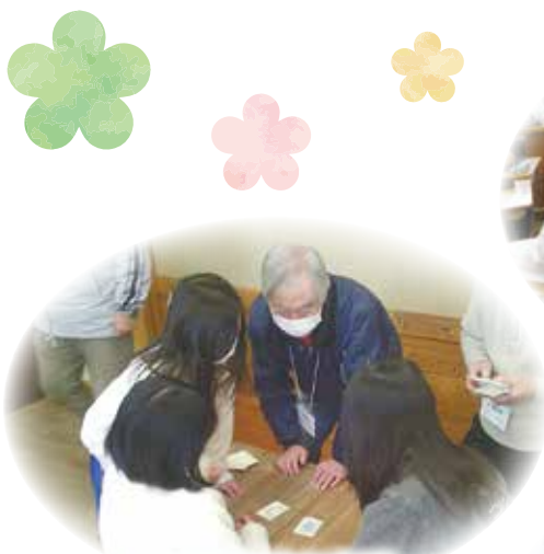
休み時間の交流 コミュニティルーム