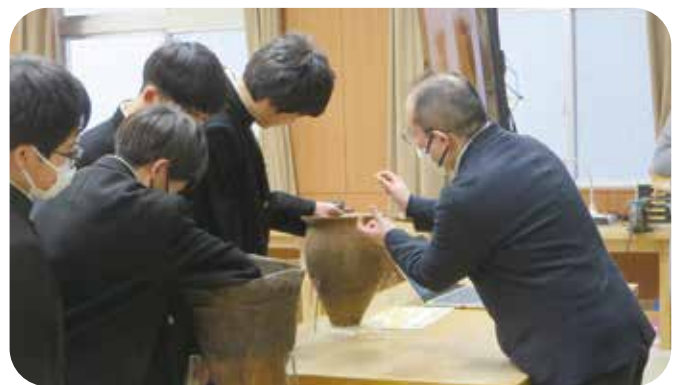
④放課後学習 第四中学校