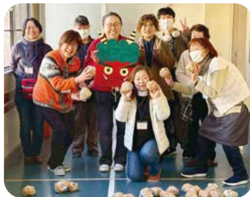
季節感を取り入れた遊びを工夫 赤鬼を新聞紙の「豆」でやっつけよう