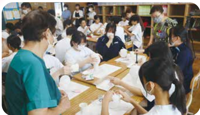
③総合的な学習 第二中学校