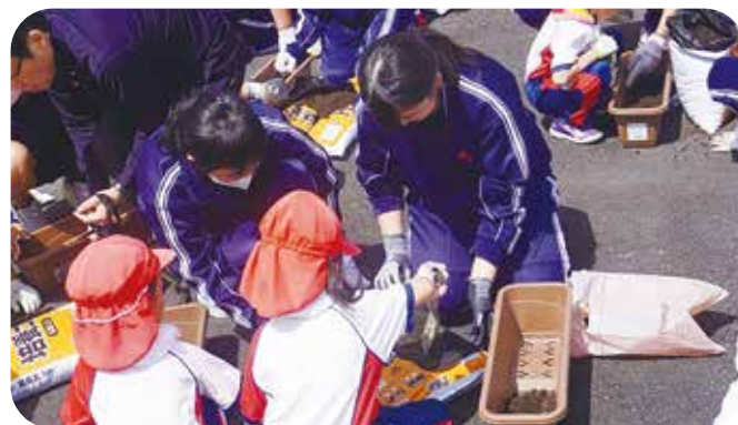
③総合的な学習 第五中学校