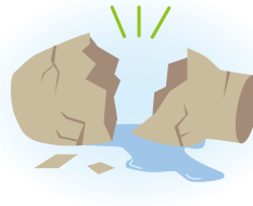
学校の備品を壊した