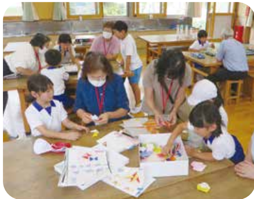
図工室でいっしょにあそぶ