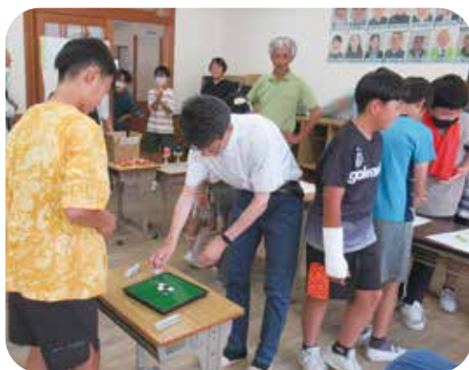
高学年も大人との対戦を楽しみに