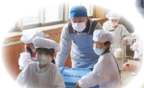
活動支援 給食サポート