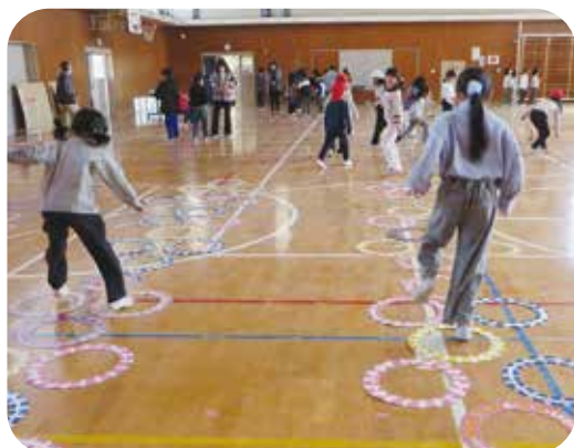
体育館でケンケンパケンケンパ 輪は牛乳パックを活用