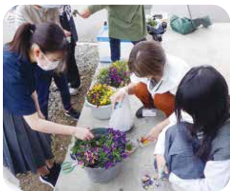
⑦環境整備 塩田中学校