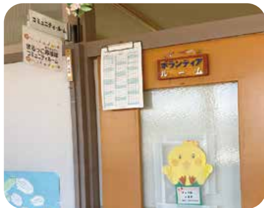
コミュニティルームのかわいい入口