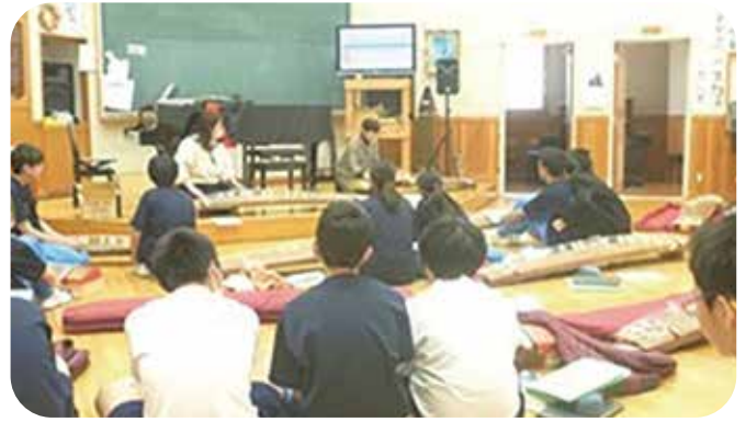
①授業サポート 依田窪南部中学校