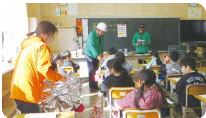
③総合的な学習 清明小学校