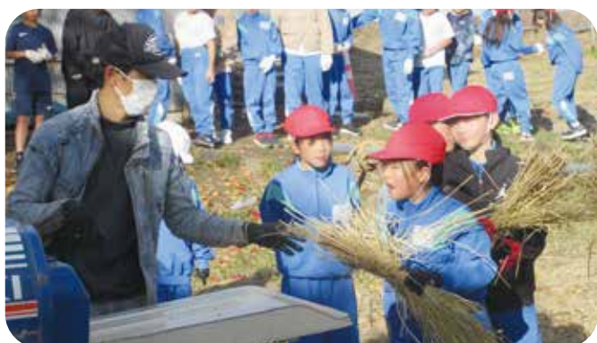
③総合的な学習 川西小学校