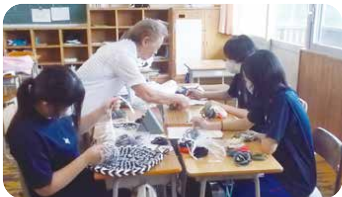
③総合的な学習 丸子北中学校