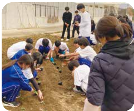
⑦環境整備 第三中学校