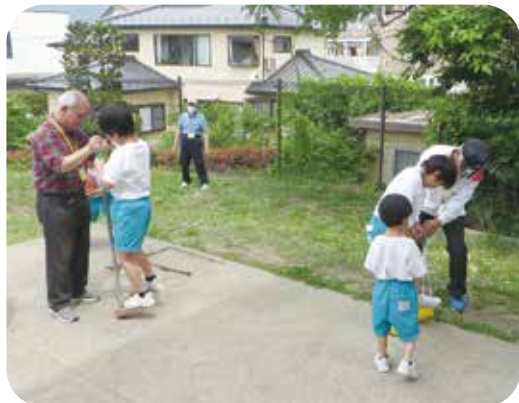
竹馬、缶ぼっくりも 地域の人が支えてくれるので安心