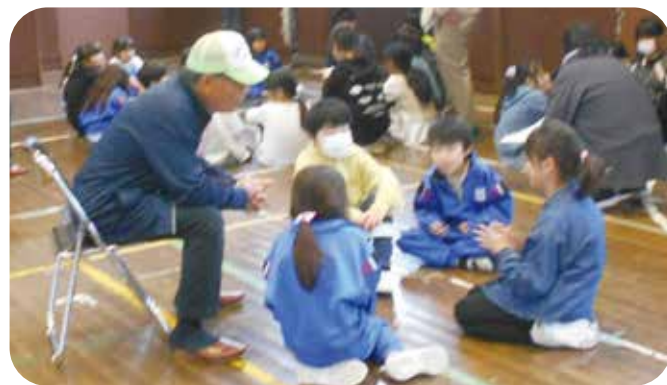
⑤見守り活動 浦里小学校