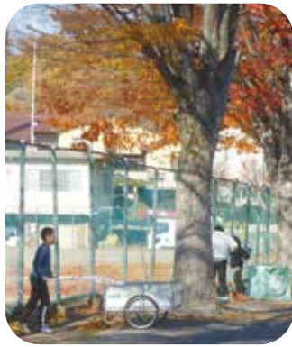
⑩校内活動支援 丸子北小学校