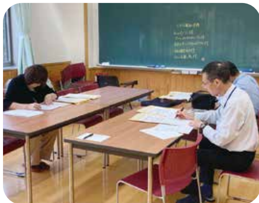
毎月曜の朝のドリルの丸付けをする ボランティアの皆さん