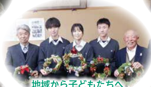
地域から子どもたちへ クリスマスリースのプレゼント