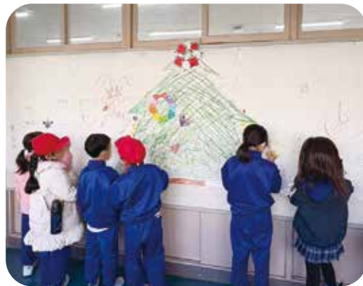
壁に貼った模造紙にお絵描き