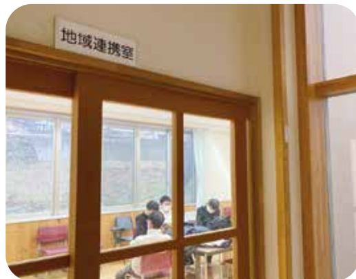
新校舎になったときにつくられた ボランティアの居場所