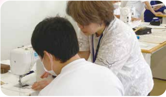
①授業サポート 第三中学校