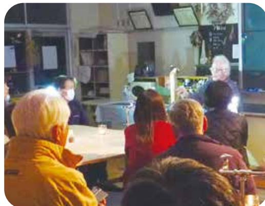
大人の学び 民話を聞く会