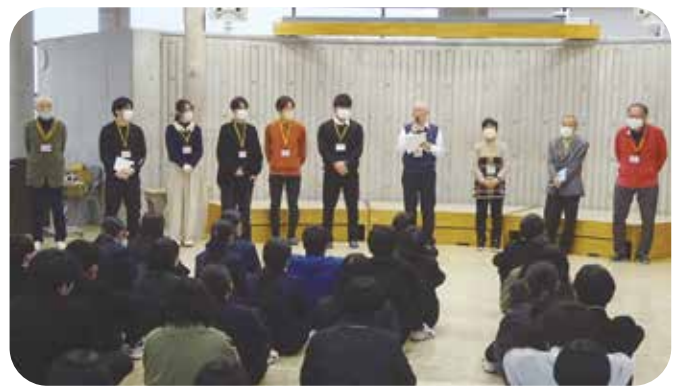
④放課後学習 第一中学校