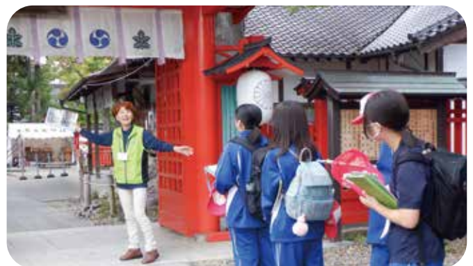
⑪行事サポート 塩田中学校