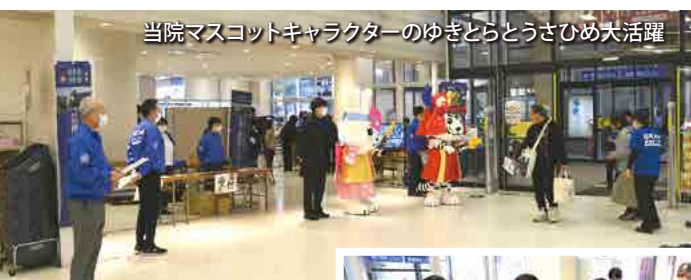
当院マスコットキャラクターのゆぎとらとうさひめ大活躍

「骨密度測定や血管測定」といった気軽に参加できるブースから、「健康相談・栄養相談、お薬相談」など専門家に相談できるブースもあります。「ロコモ度テストやBLS/AED体験」は器具を用いた体験をしていただきました。「妊婦体験・高齢者体験」など新たな試みも行い、子供から高齢の方まで楽しめる多彩なプログラムをご用意しました。