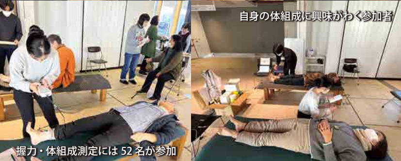
自身の体組成に興味をわく参加者