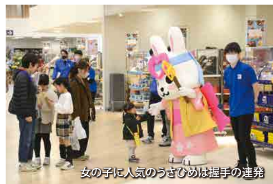
女の子に人気のうさひめは握手の連発