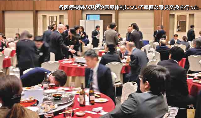
各医療機関の現状や医療体制について率直な意見交換を行った