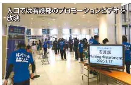
入口では看護部のプロモーションビデオを放映