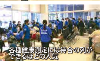
各種健康測定には待合の列ができるほどの人気