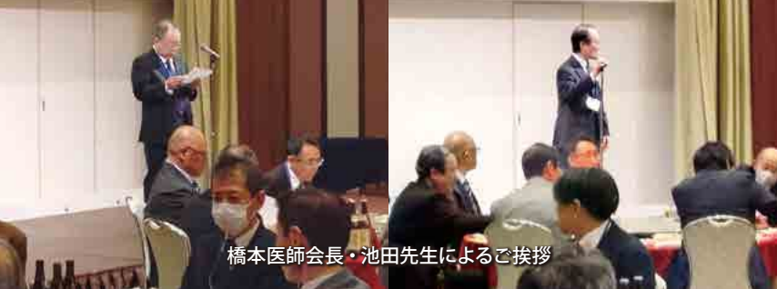
橋本医師会長・池田先生によるご挨拶