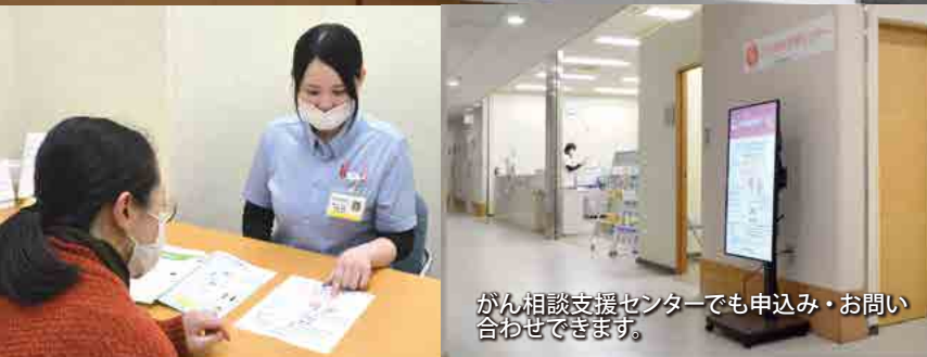
がん相談支援センターでも申込み・お問い合わせできます。