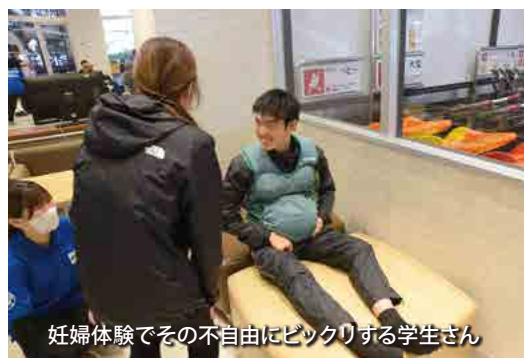
妊婦体験でその不自由さにビックリする学生さん