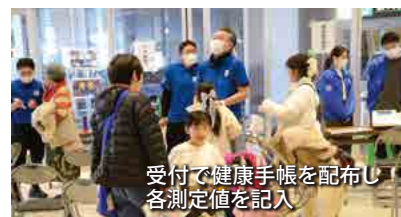
受付で健康手帳を配布し各測定値を記入

最後になりますが、本イベントの開催にご尽力いただきました関係者の皆様に厚く御礼申し上げますとともに、本日ご参加の皆様のますますのご健勝とご多幸をお祈りしております。