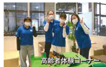
高齢者体験コーナー