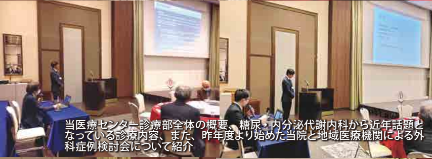
当医療センター診療部全体の概要、糖尿・内分泌代謝内科から近年話題となっている診療内容、また、昨年度より始めた当院と地域医療機関による外科症例検討会について紹介