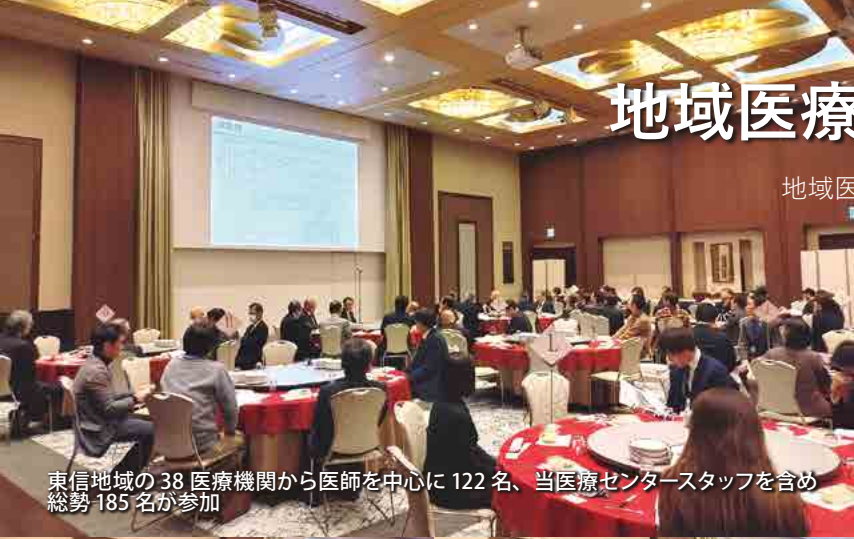
東信地域の38医療機関から医師を中心に122名、当医療センタースタッフを含め総勢185名が参加