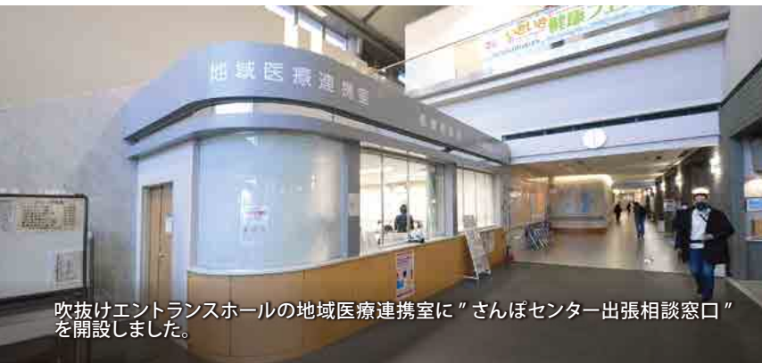
吹抜けエントランスホールの地域医療連携室に「さんぼセンター出張相談窓口」を開設しました。