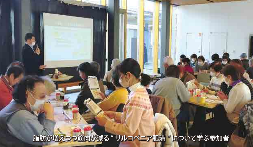
脂肪が増えつつ筋肉が減る「サルコペニア肥満」について学ぶ参加者