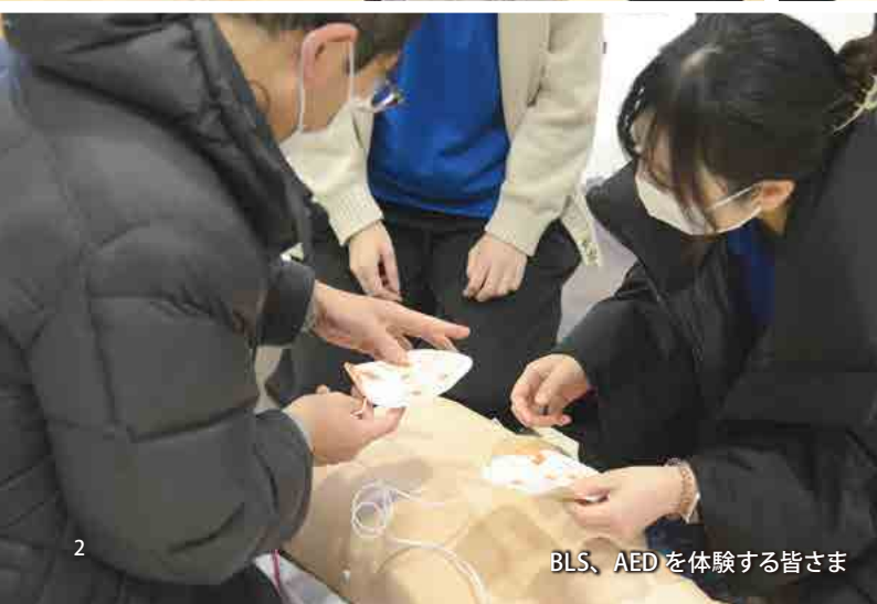
BLS、AEDを体験する皆さま