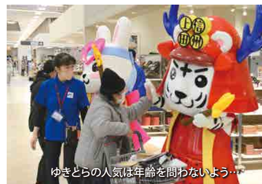
ゆきとらの人気は年齢を問わないよう…