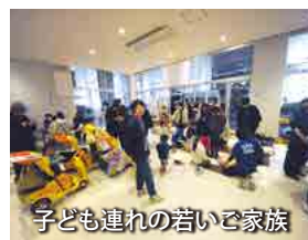
子ども連れの若いご家族