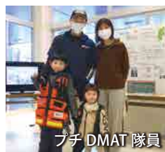
プチ DMAT 隊員