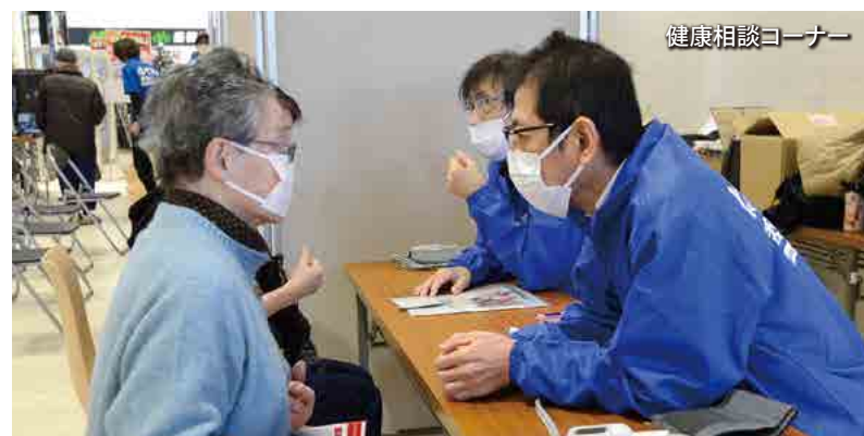
健康相談コーナー