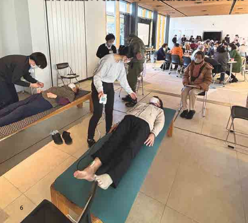
和やかな雰囲気の中で質問のコーナーや測定体験を過ごされていました

当院の地域向け「出張出前講座」の一環として、上田市の認知症カフェにて健康講座「隠れた栄養障害“サルコペニア肥満”を知ろう！～筋肉は健康寿命のカギ～」を開催しました。会場は上田市役所庁舎内 つむぎラウンジで、参加はスタッフを含め約60名でした。