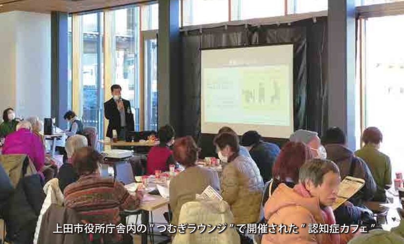
上田市役所庁舎内の「つむぎラウンジ」で開催された「認知症カフェ」