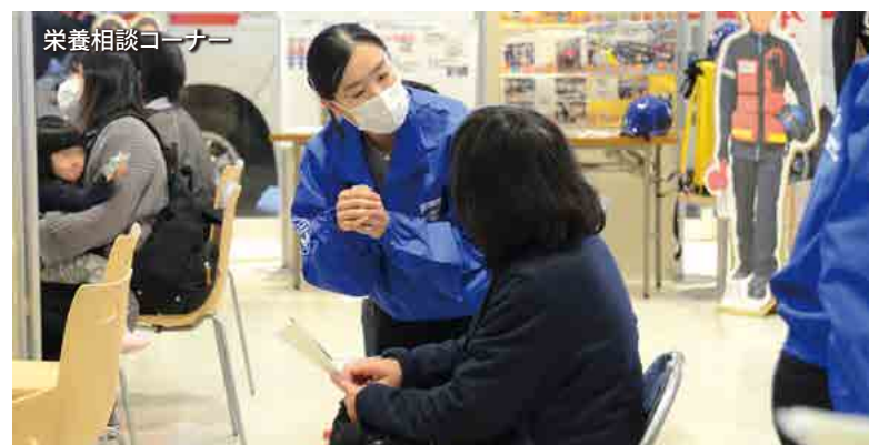
栄養相談コーナー