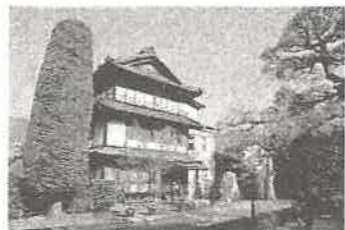
坂木宿ふるさと歴史館

日時 5月15日(金) 集合 8:30 出発 8:45 解散 12:00頃 荒天中止 コース 鉄の展示館 → 村上義清公供養塔 → 文化財センター → ふるさと歴史館 → 善光寺常夜灯 → 坂城神社 → 大英寺 → 鉄の展示館(見学) 集合場所 鉄の展示館駐車場(坂城町坂城6313-2) 参加対象 どなたでも 定員 25名 参加料 600円 持ち物 飲み物、雨具 受付 4月22日(水)9時から公民館窓口または電話で ※ 荒天が予想される場合は、前日に中止連絡をさし上げます。