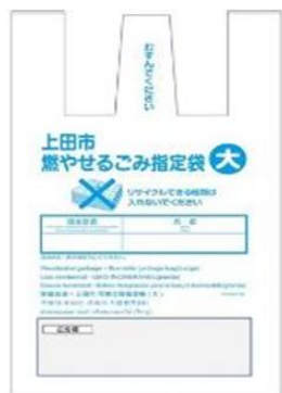
家用蓝色可燃垃圾指定袋

*带有塑料标示的塑料垃圾（请放入绿色字体垃圾袋内），因塑料垃圾会由人手选别处理，所以请不要放入购入袋内的状态扔出。