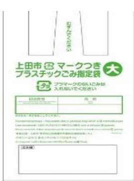
家用绿色塑料垃圾指定袋