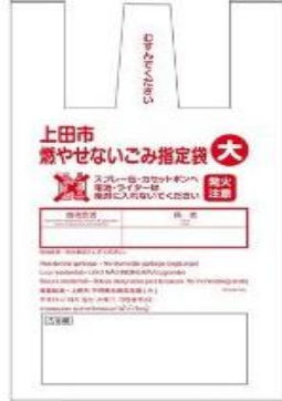
家用红色不可燃垃圾指定袋