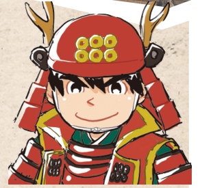
さなだのぶしげ ゆきむら 真田信繁(幸村)