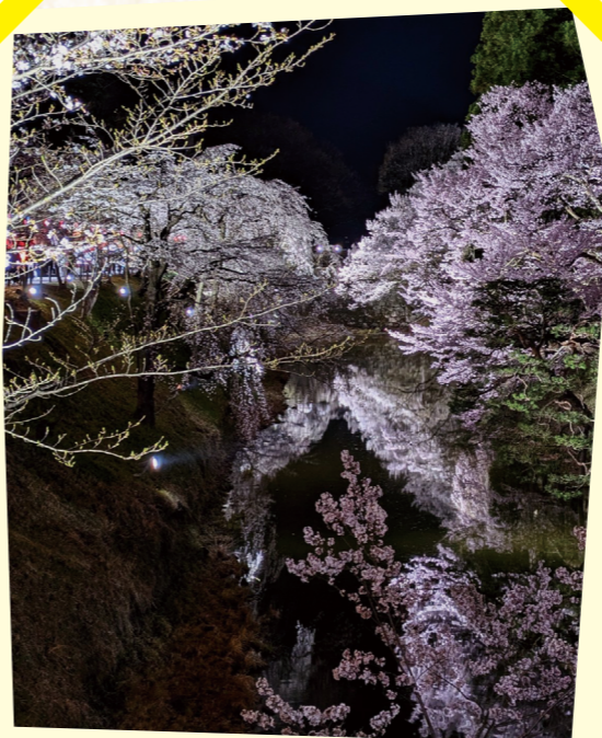
千本桜まつりのライトアップ