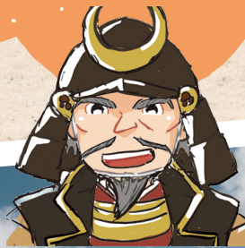
さなだまさゆき 真田昌幸