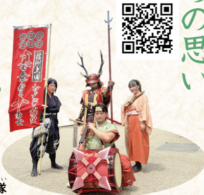
信州上田おもてなし武将隊

上田城に来るたくさんの人に記念さつえいや観光案内をして、おもてなしをしているぞ！小学生のみんなにも、上田城の歴史をぜひげん地で体験してもらいたい。上田城で待っておるぞ！