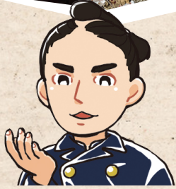
まつらいただなり 松平忠礼