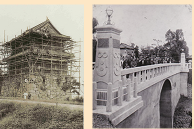
改修中の西櫓 (左) 二の丸橋 (右)