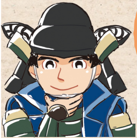
さなだのぶゆき 真田信之