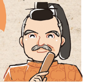
せんごくただまさ 仙石忠政