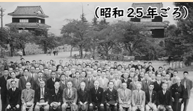
南北櫓ふく元しゅん工式