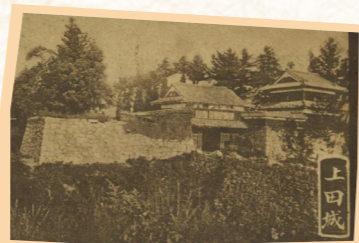
150年ほど前の上田城の写真