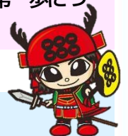
うえだ原町一番街商店会キャラ「真田幸丸」