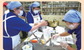
赤十字奉仕団(上田地域) 炊き出し訓練の様子

赤十字奉仕団は、赤十字の博愛人道の精神に基づき活動しているボランティア団体です。 ボランティア活動に興味のある方は、お問い合わせください。