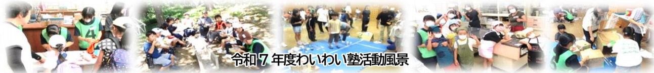
令和7年度わいわい塾活動風景

応募方法：上のQRコードからお申込みいただくか、公民館窓口に用意してあります「申し込み用紙」にご記入のうえ、公民館窓口までご提出またはFAX (24-2300) にてお申込みください。