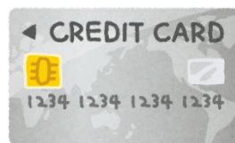
【Cartão de crédito】