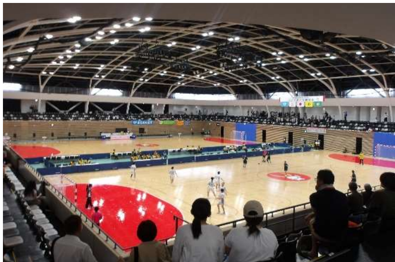
ハンドボール競技会場（プロシードアリーナHIKONE）