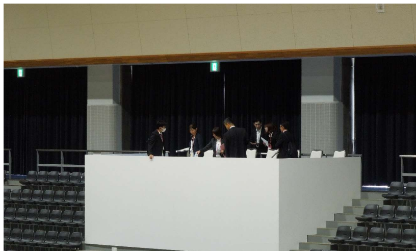
お成り警護（草津市 バスケットボール競技）