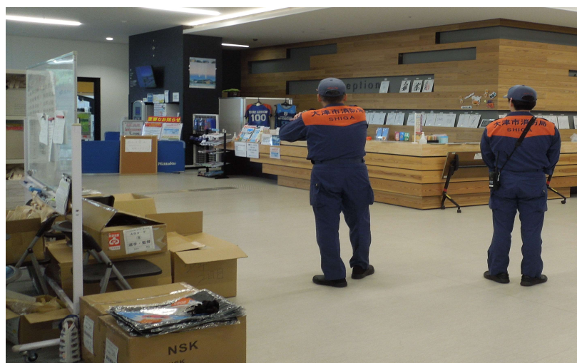
消防局による巡回