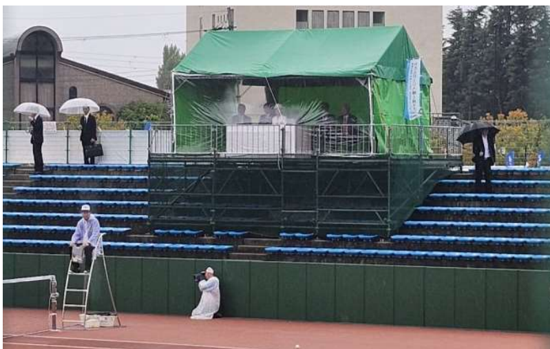
お成り（長浜市 ソフトテニス競技会場）