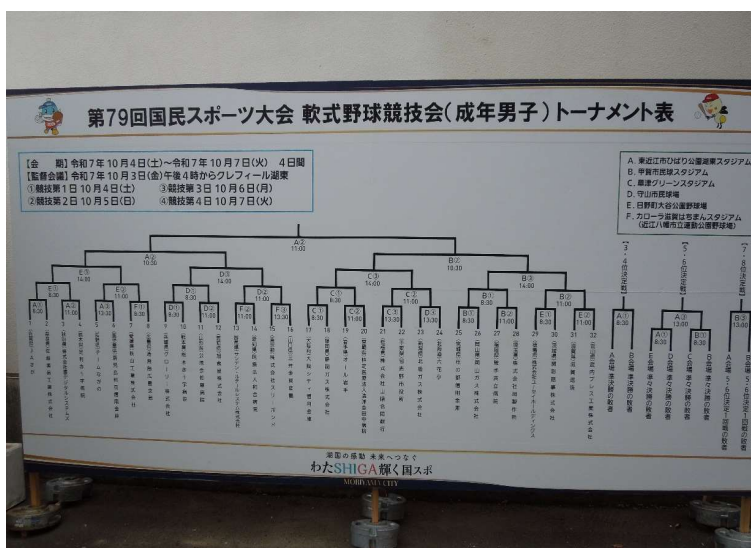
軟式野球競技 トーナメント表