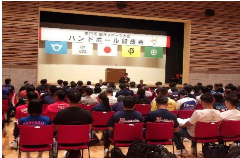
ハンドボール競技 開始式