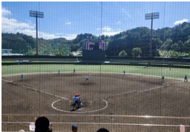
軟式野球競技会場（甲賀市民スタジアム）