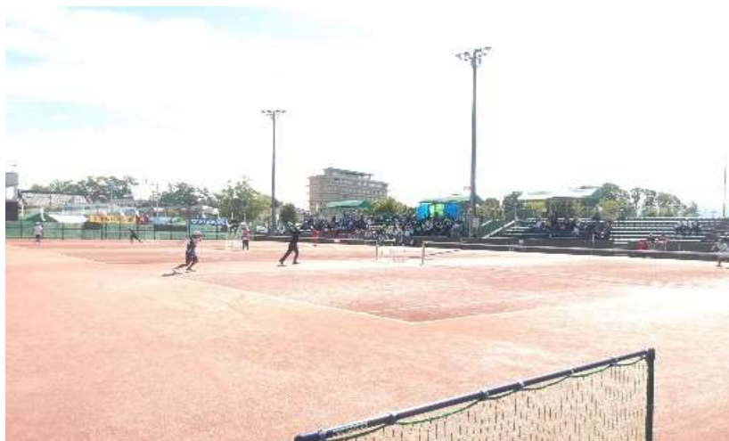
ソフトテニス競技会場（長浜城テニスガーデン）