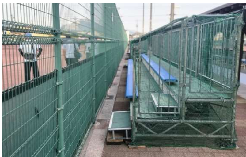
ソフトテニス競技会場 仮設観客スタンド