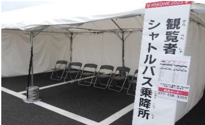
シャトルバス乗降所