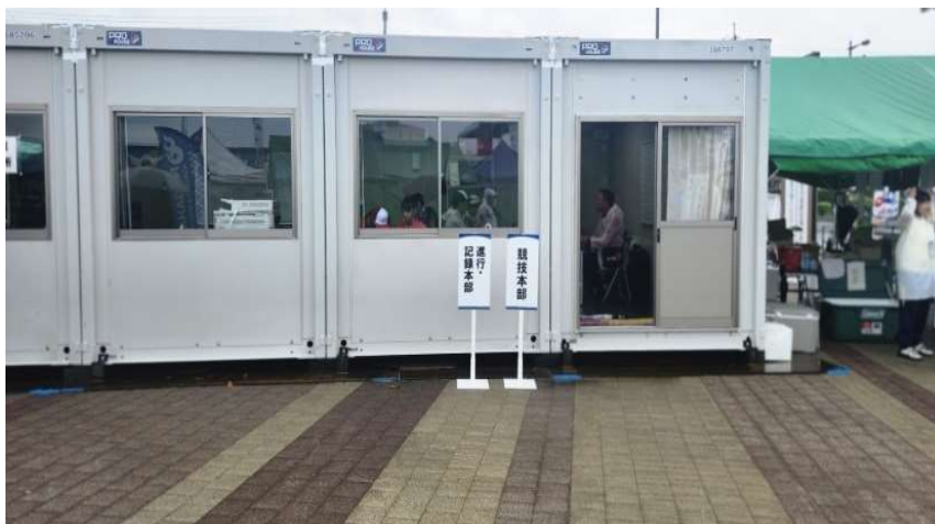
ソフトテニス競技会場 運営用プレハブ（実施本部、救護本部） （ソフトテニス競技会場の救護本部には、保健師 2 名が待機）