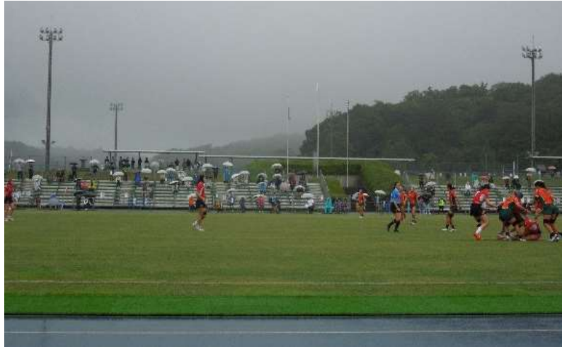
ラグビーフットボール競技会場（滋賀県希望が丘文化公園）