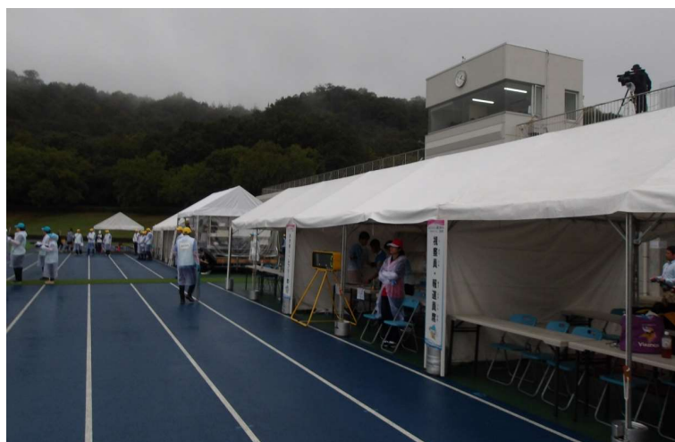
ラグビーフットボール競技会場（視察員・報道員席、ドクター、レフリー席）