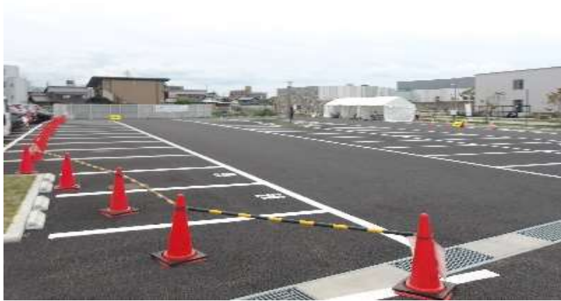
シャトルバス発着場所