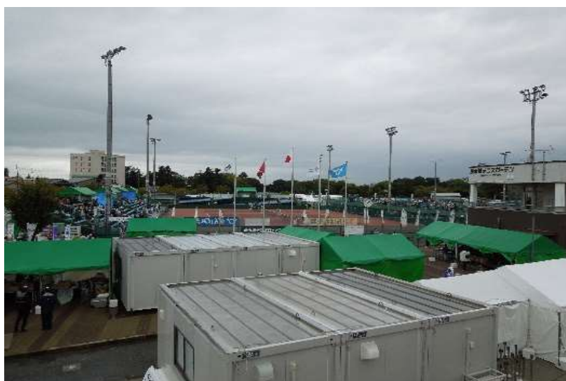
ソフトテニス会場 仮設テント・プレハブ