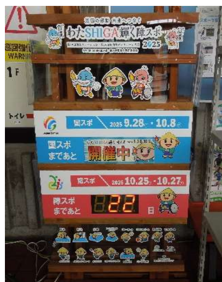
カウントダウンボード