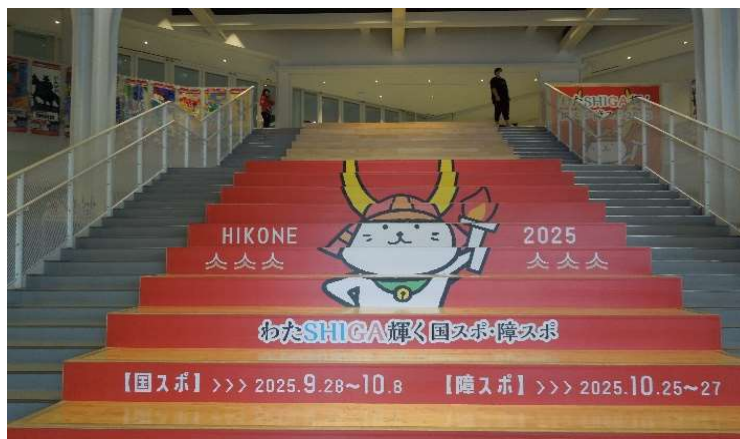
プロシードアリーナHIKONE階段装飾