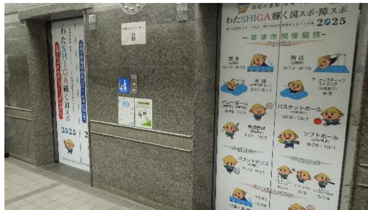
草津市役所エレベーター