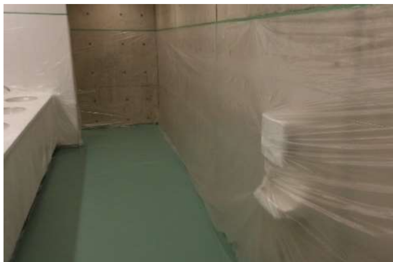
ハンドボール競技会場 トイレの松やに対策