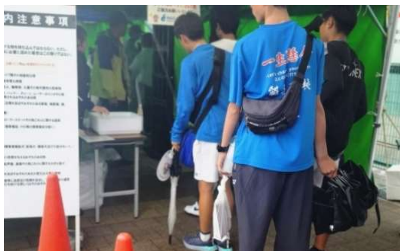
金属探知検査ゲート