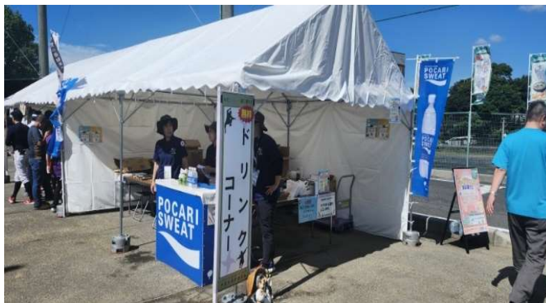
無料ドリンクコーナー