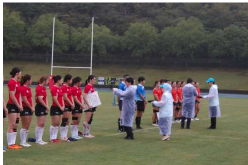
ラグビーフットボール競技 表彰式