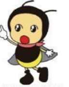
上田市上下水道局 イメージキャラクター あかりちゃん

近年、全国的に水道インフラの老朽化が深刻な局面を迎えています。水道管の老朽化だけでなく、耐震化の遅れや人口減少による収入減、水道事業に関わる職員の高齢化・人材不足、経営難に伴う財政的制約など、複数の課題が絡み合い、解決を一層難しくしています。 このような課題に対し、水道の基盤強化を目的として、上田市、長野市、千曲市、坂城町、長野県企業局で構成する「上田長野地域水道事業広域化協議会」を設置し、検討・協議を進めています。 11月4日の協議会では、今後、検討・協議を進める上で指針とする「基本計画」が合意されました。なおこの合意は、広域化を決定したものではありません。 本特集では、広域化の検討状況や今後の進め方などについてお知らせします。