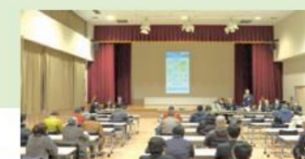
市民説明会(令和6年12月8日)

現在の計画は、10年間で約1,000億円の事業規模になっています。事業費が大きい上田・長野間の送水管の二重化事業を含め、地域全体にとって最適な施設整備計画となるよう再検討しています。