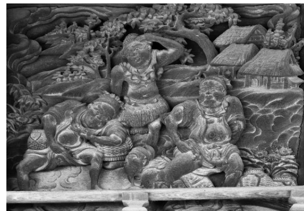
下堀 堀川神社本殿 韓信の股潜り