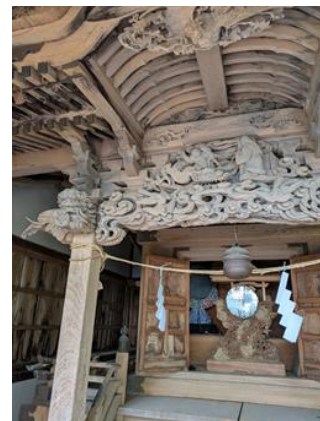
太郎山神社本殿の作品