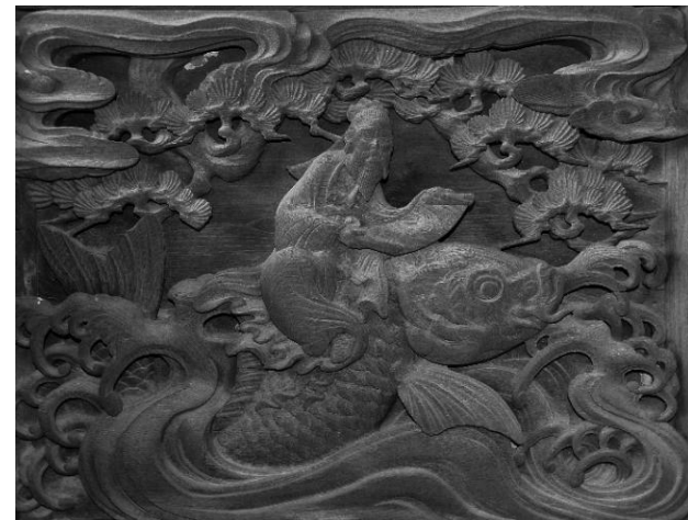
岩下 伊波保神社本殿 琴高仙人