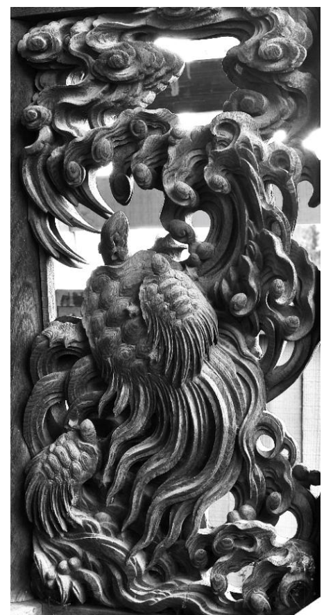
科野大宮社 昇り亀