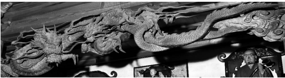
龍洞院開山堂 双龍