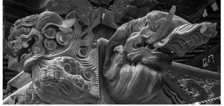
信濃国分寺 向拝 木鼻