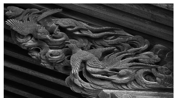
諏訪形 荒神宮本殿 手挟