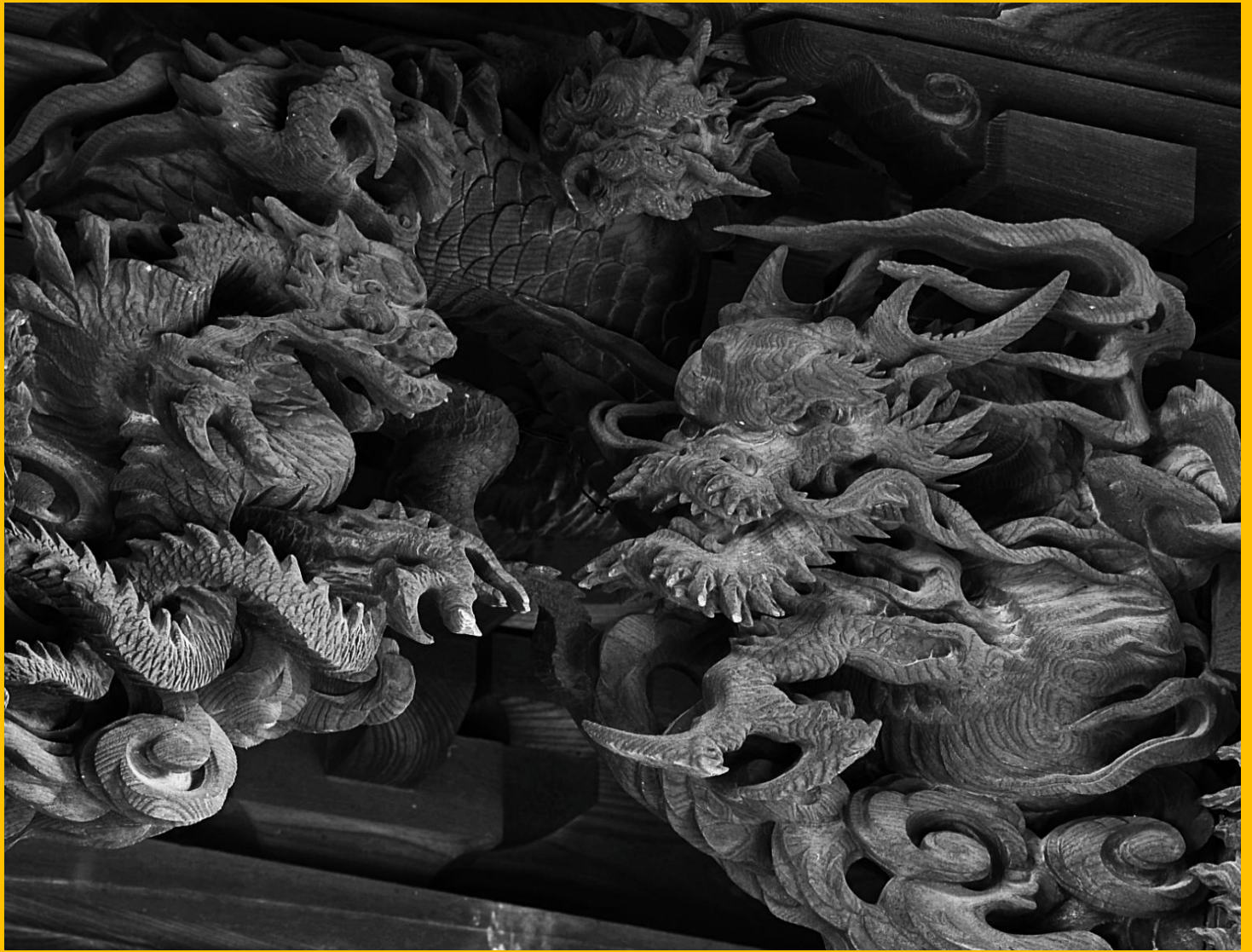
諏訪形荒神宮本殿 三匹龍