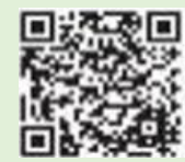
上田市防災 ポータルサイト