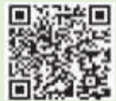
上田市災害 ハザードマップ

「上田市防災ポータルサイト」是上田市的多言语防灾网站, 可以确认在发生灾害时的各种紧急信息及交通管制信息等紧急信息。(例如: 逃生场所 逃生信息 暴雨预报和警报等)